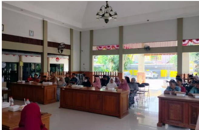
Gambar 2. Sosialisasi dan Pemberian Materi pada Tahap Perispan Kegiatan

konsentrat, mineral, dan mikroba probiotik atau EM4. Tahap persiapan berupa sosialisasi dengan kelompok difabel dapat dilihat pada Gambar 2.