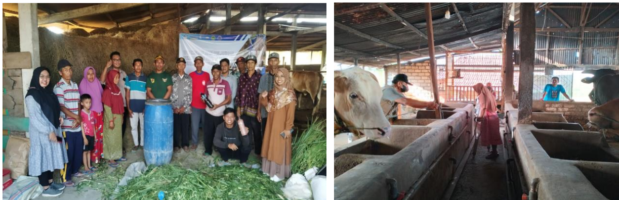
Gambar 3. Pelatihan Pembuatan Pakan Ternak Silase