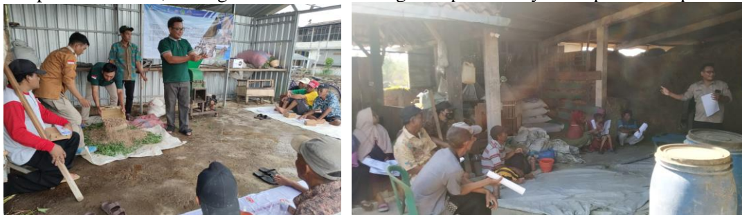
Gambar 4. Kegiatan Evaluasi Kegiatan Pelatihan Pemeliharaan dan Pembuatan Pakan Fermentasi Silase

Evaluasi kegiatan dilaksanakan agar tujuan program kegiatan dapat tercapai sesuai dengan indikator yang telah di tentukan. Selain itu, evaluasi juga merupakan salah satu komponen penting untuk mengukur seberapa baik penyelenggaraan suatu kegiatan pelatihan (Tamsuri 2022). Dalam mendukung evaluasi, perlu media penyebaran kuisioner dengan beberapa pertanyaan untuk mengetahui ketercapaian indikator tersebut. Indikator keberhasilan pelaksanaan PKM meliputi kegiatan evaluasi yaitu pengisian angket (kuisioner) mengenai pelaksanaan kegiatan pelatihan dan penyuluhan serta hasil kegiatan yang telah dilakukan. Secara keseluruhan, respon yang sangat positif ditunjukkan oleh masyarakat difabel terhadap pelaksanaan kegiatan PKM ini, terlihat dari tingginya rasa ingin tahu, motivasi dan partisipasi masyarakat difabel dalam pelaksanaan seluruh rangkaian kegiatan pemberdayaan yang telah dilakukan. Kegiatan evaluasi kegiatan dapat dilihat pada Gambar 4, sedangkan hasil evaluasi kegiatan pemberdayaan dapat dilihat pada Tabel 1.