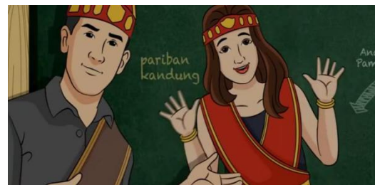
Gambar 5. Ilustrasi Pariban Dan Halomoan