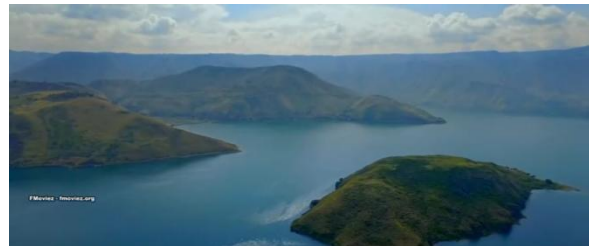
Gambar 2. Danau Toba