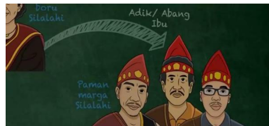
Gambar 4. Ilustrasi Paman Halomoan