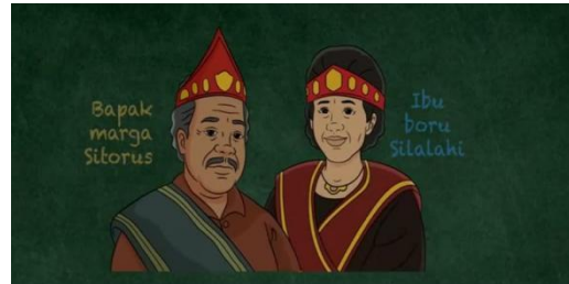
Gambar 3. Ilustrasi Ayah Ibu Halomoan