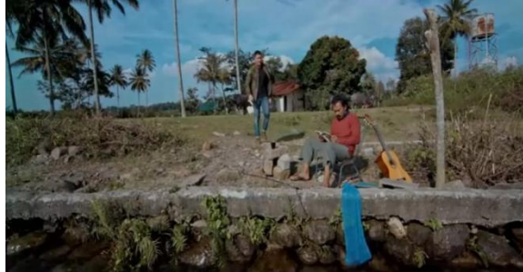
Gambar 6. Halomoan Menyapa Tulangnya