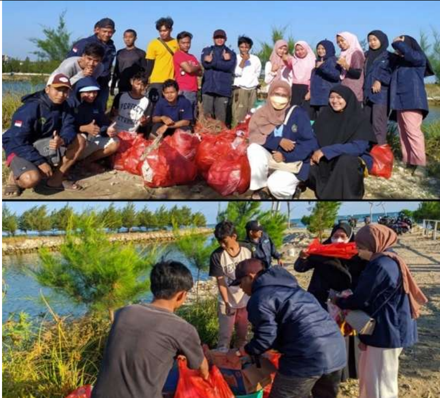
Gambar 3. Kegiatan Bakti Sosial