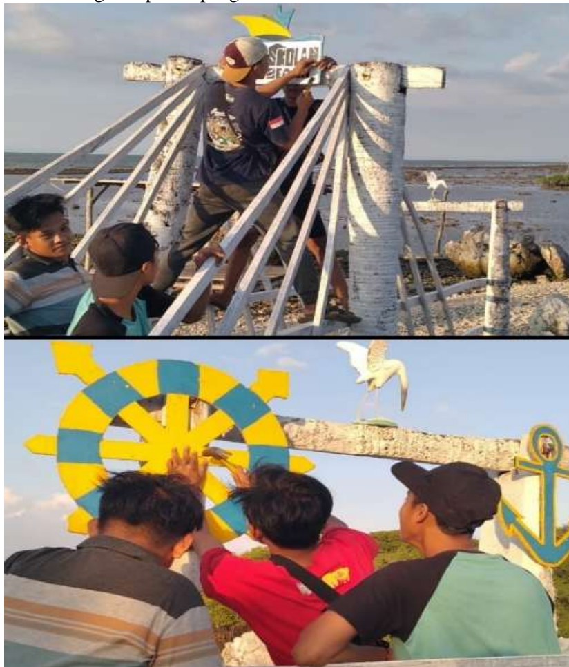
Gambar 5. Perbaikan dan Penambahan Spot Foto

adalah dengan memberikan fasilitas spot foto yang bagus atau istilah kerennya instagramable . Bagi pengunjung yang ingin menikmati udara segar, menikmati senja di sore hari bisa duduk-duduk santai di gazebo yang telah ada di pantai pengkolan tersebut sambil menikmati keindahan mangrove yang terbentang luas. Mangrove tersebut tumbuh lebat dan subur sehingga ketika sore hari banyak burung-burung berterbangan diatas hutan mangrove pantai pengkolan.