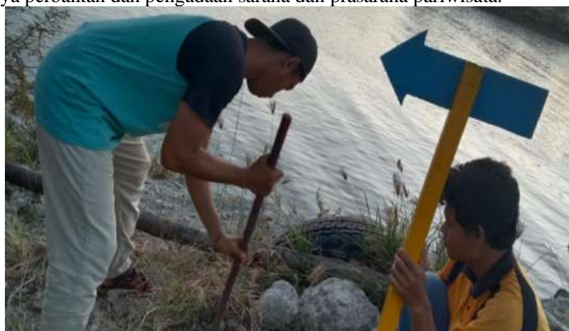
Gambar 4. Pembuatan Papan Penunjuk Arah

Pantai Pengkolan Desa Kandang Semangkon Lamongan merupakan pantai yang tidak berpasir melainkan penuh serpihan karang dan bebatuan. Karang tersebut merupakan karang yang sudah mati bahkan ada yang membentuk pulau kecil. Hutan mangrove membentang ratusan meter di pantai ini sehingga menambah daya tarik tersendiri dari wisata tersebut, namun sarana dan prasarana di pantai pengkolan sebelum diadakannya kegiatan PKM masih sangat minim sekali, bahkan banyak yg sudah rusak. Oleh karena itu perlu diadakannya perbaikan dan pengadaan sarana dan prasarana pariwisata.