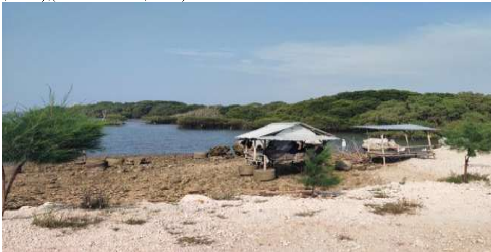
Gambar 1. Pantai pengkolan

Desa Wisata Pantai (DWP) pada hakekatnya adalah mengembangkan dan memanfaatkan obyek serta daya tarik wisata bahari di kawasan pesisir dan laut, berupa kekayaan laut yang indah, keragaman flora dan fauna. Wisata bahari merupakan kegiatan berwisata yang mengandalkan daya tarik panorama alam dan lingkungan pesisir dan lautan dengan aktivitas minat khusus yang berupa kegiatan memancing, snorkling, berenang, menyelam, berlayar, berselancar, rekreasi pantai, berjemur, dan lain-lain (Dahuri et al., 2001). Dengan potensi yang demikian besar, dapat memberikan manfaat bagi pembangunan umumnya dan peningkatan pendapatan masyarakat khususnya, maka dalam pelaksanaannya dibutuhkan strategi yang terencana, sistematis dan terintegrasi dengan pengembangan masyarakat nelayan yang aktivitas umumnya tidak lepas dari laut dan pantai (Masrun et al., 2019);(Silvitiani et al., 2017).