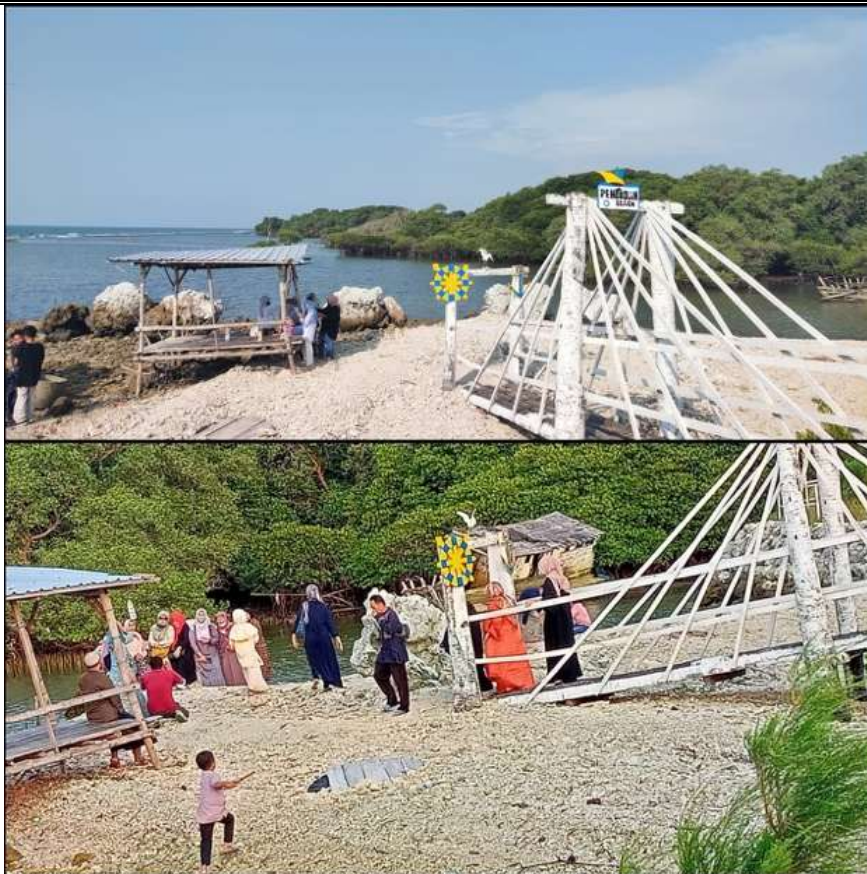
Gambar 6. Banyaknya Pengunjung Pantai Pengkolan