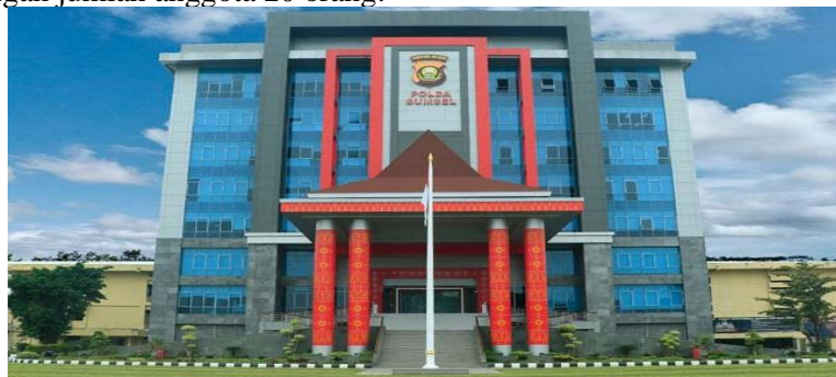
Gambar 1. Polda Sumatera Selatan

Bagaimana proses pelaksanaan tes psikologi untuk anggota polri yang mengambil senjata api di Polda Sumatera Selatan dengan jumlah anggota 20 orang.