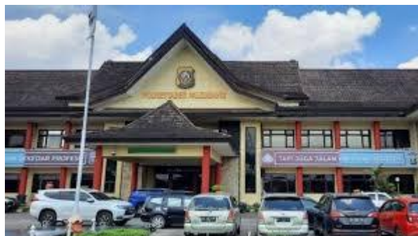
Gambar 1. Polrestabes Kota Palembang

Meningkatnya kasus pembullying yang dilakukan oleh siswa-siswa yang ada disekolah. hal ini membuat polrestabes kota Palembang melalui bhabinkamtibmas melakukan Upaya sosialisasi berkaitan dengan bullying.