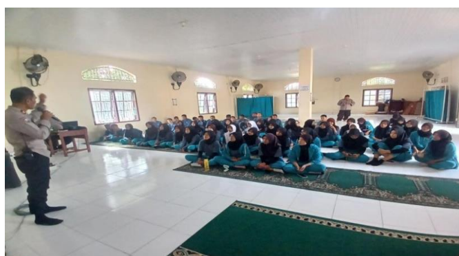
Gambar 2. Pelaksanaan Sosialisasi

Dalam kegiatan sosialisasi yang dilakukan bhabinkamtibmas polrestabes Palembang bertujuan untuk meningkatkan kesadaran siswa terhadap bahaya bullying dan memberikan wawasan yang diperlukan guna mencegahnya. Jadi dengan adanya sosialisasi ini bisa membuat siswa menjadi lebih kuat dan berani, mungkin bisa juga menjadi lebih menghargai sesama manusia, dan menjadi lebih baik serta mulai bisa berhati-hati daam perbuatan juga ucapan. Dampak negatif yang dirasakan akibat bullying adalah marah, rasa dendam, rasa tertekan, mau, dan merasa sedih. Bahkan, emosi negative pun sering dirasakan oleh korban bullying.