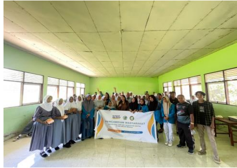
Gambar 1. Lokasi Pengabdian Masyarakat