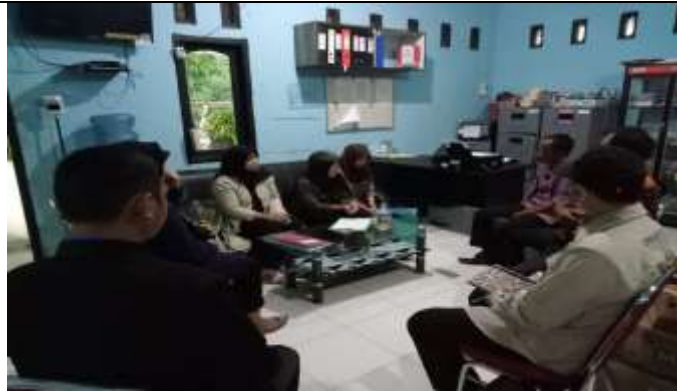
Gambar 1. Kegiatan FGD dan Perizinan

Tahapan berikutnya dilakukan kegiatan utama dalam pengabdian, yaitu sosialisasi yang menjelaskan tentang pentingnya Pendidikan, Pendidikan memiliki peranan penting melalui Pendidikan dapat memberikan seseorang sebuah keterampilan yang dibutuhkan. Pendidikan membantu seseorang untuk membuat Keputusan yang baik dan meningkatkan peluang dalam berhasil dalam kehidupan, membantu dalam menafkahi keluarga, membantu berinteraksi lebih baik di lingkungan. Materi kedua tentang peran orang tua sebagai madrasah pertama, Keluarga memiliki peran strategis dalam hal Pendidikan anak, karena tempat untuk belajar dan berkembang dan tau tentang dunia (Safriana & Khasanah, 2019) sebagaimana terlampir dalam Gambar 2.