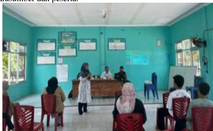
Gambar 3. Sesi Pemaparan

Pemaparan dilakukan selama masing-masing 60 menit dan dilakukan oleh dua orang narasumber yang merupakan praktisi di bidang pendidikan. Tujuan pemaparan yaitu untuk mempengaruhi perilaku anak putus sekolah yang menjadi peserta dengan cara penyampaian pesan untuk mencapai tujuan hidup baik secara individual maupun kelompok (Manyullei et. Al, 2022). Pemaparan bersifat interaktif sehingga tidak terkesan satu arah. Setelah dilakukan pemaparan oleh masing-masing narasumber, dilanjutkan dengan kegiatan diskusi dan tanya jawab oleh narasumber dan peserta.