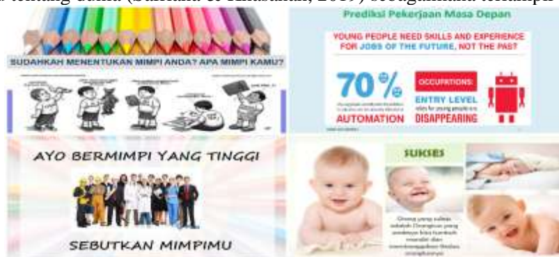
Gambar 2. Materi Pengabdian

Tahapan berikutnya dilakukan kegiatan utama dalam pengabdian, yaitu sosialisasi yang menjelaskan tentang pentingnya Pendidikan, Pendidikan memiliki peranan penting melalui Pendidikan dapat memberikan seseorang sebuah keterampilan yang dibutuhkan. Pendidikan membantu seseorang untuk membuat Keputusan yang baik dan meningkatkan peluang dalam berhasil dalam kehidupan, membantu dalam menafkahi keluarga, membantu berinteraksi lebih baik di lingkungan. Materi kedua tentang peran orang tua sebagai madrasah pertama, Keluarga memiliki peran strategis dalam hal Pendidikan anak, karena tempat untuk belajar dan berkembang dan tau tentang dunia (Safriana & Khasanah, 2019) sebagaimana terlampir dalam Gambar 2.