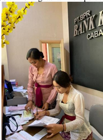
Gambar 3. Observasi Partisipatif

Secara keseluruhan, aplikasi EZ-Bank Kertiawan Mobile telah berhasil menawarkan solusi digital yang efisien untuk proses pembukaan rekening. Hasil penelitian menunjukkan bahwa aplikasi ini memberikan keamanan data yang memadai dan tingkat kepuasan pengguna yang tinggi, meskipun ada beberapa tantangan teknis yang perlu diatasi. Melalui pemantauan umpan balik pengguna dan penerapan perbaikan berdasarkan hasil penelitian, Bank Kertiawan dapat terus meningkatkan kualitas layanan mereka, memastikan pengalaman pengguna yang lebih baik, dan meningkatkan citra perusahaan di mata nasabah.