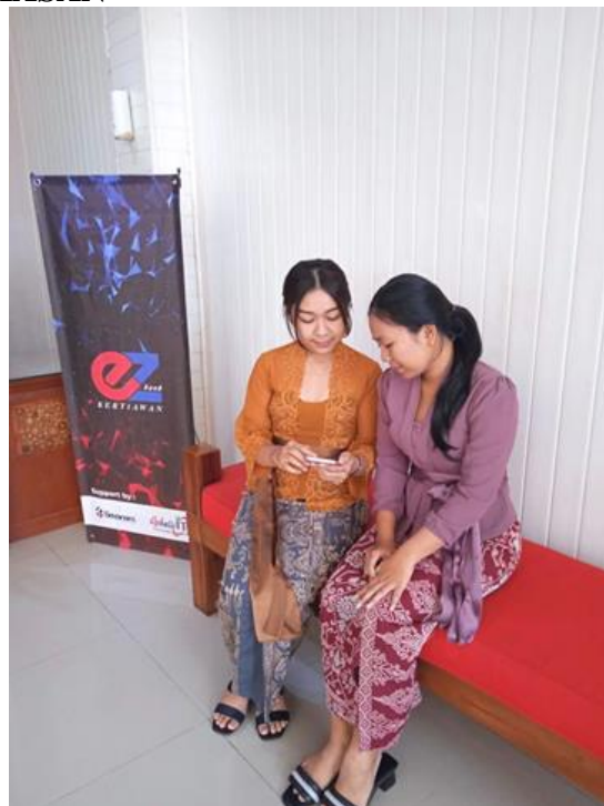
Gambar 2. Wawancara terkait Aplikasi EZ Bank Kertiawan Mobile

Berdasarkan rumusan masalah terkait pelayanan akses pembukaan rekening melalui aplikasi EZ-Bank Kertiawan Mobile di Kota Gianyar, hasil penelitian menunjukkan bahwa tingkat kecepatan proses pembukaan rekening bervariasi. Kecepatan proses dipengaruhi oleh kestabilan jaringan internet dan ketersediaan perangkat mobile. Beberapa pengguna mengalami keterlambatan akibat masalah teknis, seperti koneksi internet yang tidak stabil atau perangkat yang kurang memadai. Meskipun demikian, sejalan dengan penelitian dari (Mardia et al., 2024) banyak pengguna yang dapat membuka rekening tanpa harus mengunjungi kantor fisik bank, menganggap proses ini efektif dan memberikan kemudahan serta efisiensi dalam layanan.