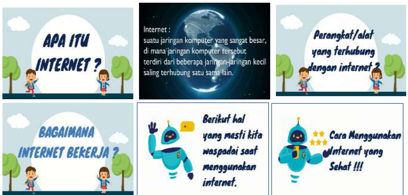
Gambar 4. Potongan Video Edukasi Internet Sehat