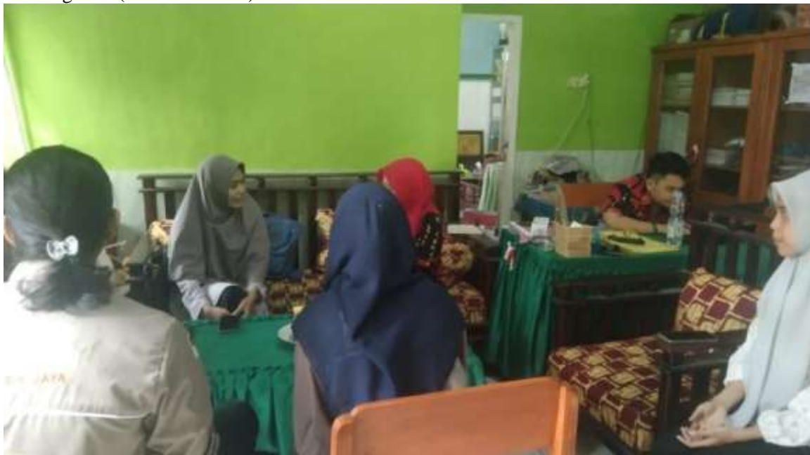
Gambar 1. Koordinasi dengan Kepala Sekolah dan Guru SD Negeri Mangasa

Kegiatan Pengabdian Kepada Masyarakat dimulai dengan koordinasi antara tim pengabdian dan pihak mitra di SD Negeri Mangasa, Kabupaten Gowa. Proses ini meliputi penentuan waktu, lokasi, dan jumlah peserta yang terlibat. Koordinasi ini penting untuk memastikan semua pihak memahami tujuan dan metode pelaksanaan kegiatan (lihat Gambar 2).