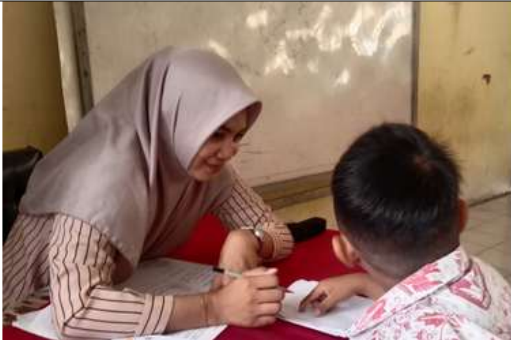
Gambar 2. Peserta menjelaskan pola penggunaan internet dan gadget

Kegiatan diawali dengan diskusi interaktif, di mana peserta diminta untuk menjelaskan pengetahuan mereka tentang perangkat gadget dan pola penggunaan internet. Hasil diskusi interaktif menunjukkan bahwa kegiatan yang paling banyak dilakukan oleh peserta adalah mengerjakan tugas sekolah, di mana penggunaan fasilitas internet menjadi sangat membantu dalam proses belajar mengajar. Hadirnya fasilitas internet dapat dimanfaatkan guru selaku pendidik sebagai sarana transfer informasi materi interaktif ke siswa sehingga memudahkan pelaksanaan kegiatan belajar mengajar di kelas (Z. Azhar, 2023).