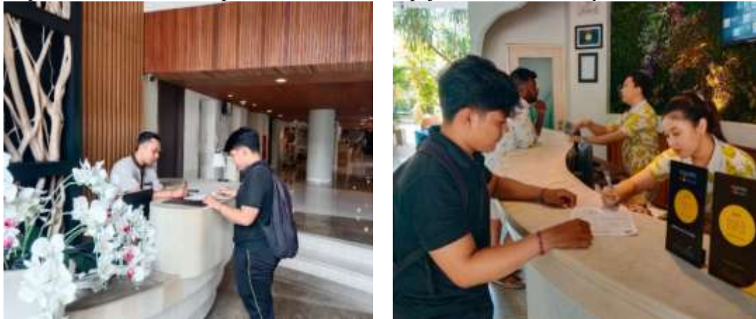
Gambar 6. Pendistribusian SKPD Pajak Air Tanah

sering kali menghadapi beberapa kendala yaitu seperti hujan dan wajib pajak tutup. Namun beberapa kendala tersebut tidak menghalangi petugas lapangan untuk menuntaskan tugasnya. Dengan 3 sampai 4 hari dapat terselesaikan untuk pendistribusian SKPD pajak air tanah di wilayah Kuta.