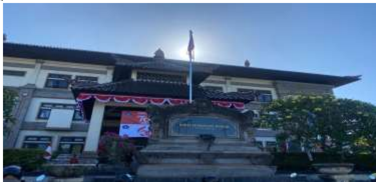
Gambar 1. Lokasi Kegiatan

Selain kendala lapangan, adapun masalah teknis seperti mesin cetak yang tidak berfungsi dengan baik sehingga pada saat penerbitan dokumen SKPD pajak air tanah dapat menghambat berlangsungnya pendistribusian dokumen SKPD pajak air tanah kepada wajib pajak. Kendala-kendala ini berpotensi menyebabkan keterlambatan penerimaan SKPD pajak air tanah oleh wajib pajak yang dapat mengakibatkan wajib pajak terkena sanksi denda sejumlah 1% pada saat jatuh tempo. Wilayah Kuta yang merupakan pusat kegiatan ekonomi dan pariwisata terdapat banyak wajib pajak dari berbagai sektor seperti hotel, mall, villa, restoran, club, dan perusahaan jasa laundry besar. Meskipun demikian petugas lapangan harus tetap berupaya untuk menyelesaikan tugas mereka dalam mendistribusikan dokumen SKPD pajak air tanah kepada wajib pajak di wilayah Kuta.