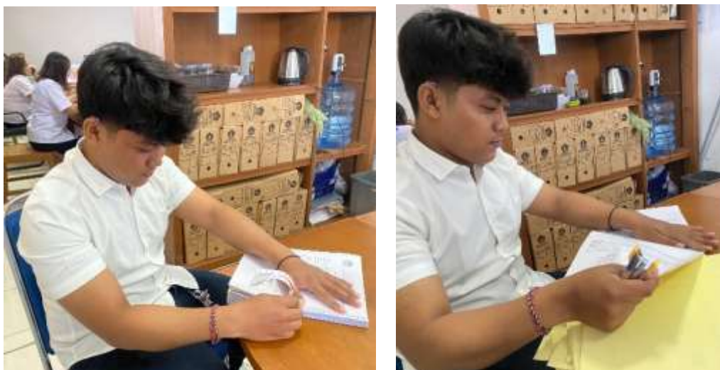
Gambar 5. Pemilahan dan Pengelompokan SKPD Pajak Air Tanah