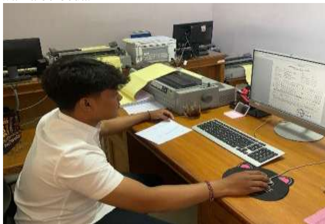
Gambar 3. Penerbitan SKPD Pajak Air Tanah