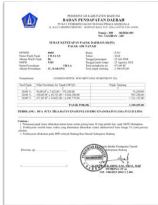
Gambar 4. Bukti SKPD Pajak Air Tanah