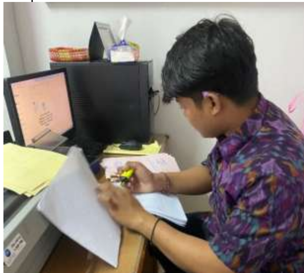
Gambar 7. Pengarsipan SKPD Pajak Air Tanah

Setelah distribusi selesai, proses pengarsipan dilakukan untuk menyimpan salinan SKPD pajak air tanah sesuai dengan urutan Nomor Pokok Wajib Pajak Daerah (NPWPD). Kegiatan pengarsipan dilakukan dengan mencontreng urutan NPWPD dari SKPD pajak air tanah untuk memastikan semua SKPD pajak air tanah aman sebelum diarsipkan. Pengarsipan yang terstruktur memungkinkan dipermudah mengakses dokumen saat diperlukan.