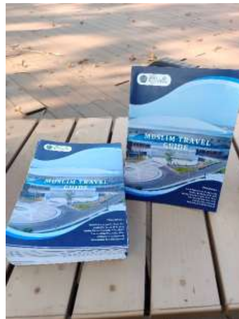
Gambar 4. Produk Muslim Travel Guide