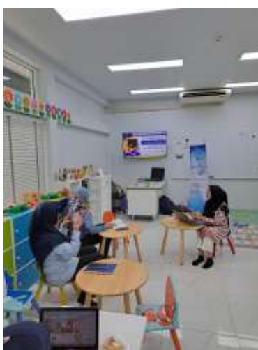
Gambar 1. Situasi SIB Bangkok