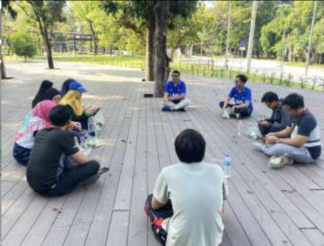
Gambar 2. Situasi dan Kondisi Kalangan Mahasiswa