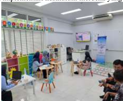
Gambar 6. Pelatihan Penyusunan KOSP