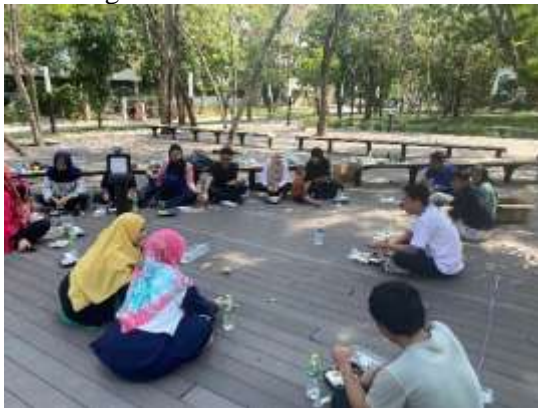
Gambar 5. Sosialisasi dan Screening Kesehatan

dapat mencegah timbulnya masalah kesehatan yang lebih serius, yang dapat mempengaruhi kualitas hidup mereka di luar negeri.