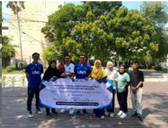
Gambar 6. Dokumentasi Tim

Selanjutnya pada kegiatan pendidikan yaitu Pelatihan dan pengembangan kompetensi guru dan staf pendidikan dalam menyusun, mengembangkan serta mengaplikasikan KOS (Kurikulum Operasional Sekolah) kurikulum merdeka Pada poin kegiatan ini dilaksanakan pelatihan terkait dengan implementasi Kurikulum Operasional Sekolah (KOS). Komponen KOS merupakan kurikulum merdeka untuk menciptakan, mengembangkan, dan menerapkan KOS. Aplikasi KOS adalah bagian penting dari kurikulum merdeka belajar karena digunakan untuk mencapai tujuan pembelajaran di satuan pendidikan anak usia dini. Aplikasi KOS membantu proses pembelajaran yang berpusat pada siswa dan kontekstual. Ini mengintegrasikan elemen sosial-budaya yang penting bagi siswa yang tinggal di Thailand untuk mempertahankan identitas Indonesia mereka. Inti dari kegiatan ini adalah bagaimana caranya guru PAUD dapat mengimplementasikan poin-poin KOS pada konten pembelajaran PAUD dengan menginternalisasi nilai budaya Indonesia kepada peserta didik.