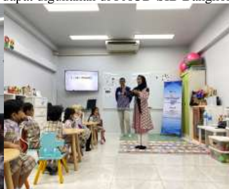
Gambar 7. Implementasi KOSP