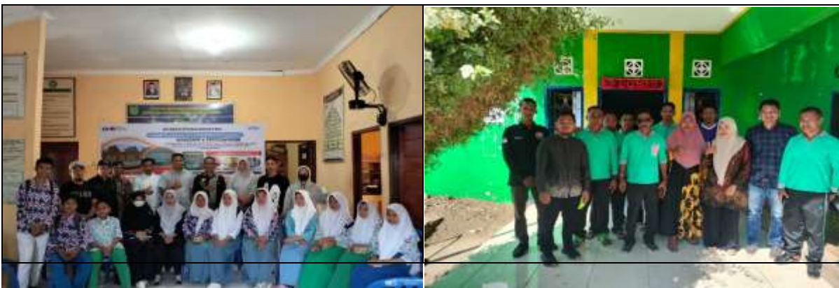
Gambar 2. Mitra Desa Panda

Permasalahan prioritas yang disepakati dengan mitra desa meliputi; 1). Kelengkapan pemetaan obyek-obyek yang bisa dikembangkan berbasis wisata olahraga dan kesehatan, 2). Kesiapan kelembagaan untuk pengelolaan wisata olahraga, 3). Edu wisata olahraga dan kesehatan tentang perilaku hidup bersih dan sehat di kawasan wisata.