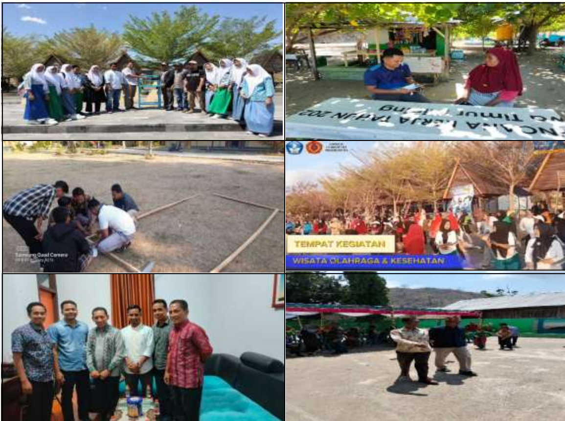
Gambar 4. Penyerahan Fasilitas, Pendampingan Mitra, Penguatan Kelembagaan Pokdarwis di Dinas Pariwisata dan Dinas Pendidikan Kab. Bima

Lokasi desa wisata Desa Panda didukung oleh beberapa transportasi umum seperti Bandara Sultan Muhammad Salahuddin Bima dengan waktu perjalanan 5 menit kendaraan pribadi dan taksi. Jalur Barat lintas nasional yang menghubungkan Pulau Sumbawa- Pulau Lombok (Mandalika-Sengigi)- Bali (Sanur-Kuta-Nusa Dua-Ubud) dari. Jalur timur menghubungkan pulau Komodo dan Labuan Bajo sebagai Destinasi Wisata