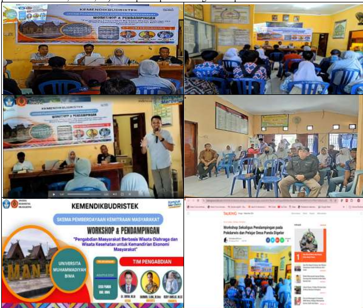
Gambar 3. Workshop Kepada Mitra Pokdarwis Desa Panda

Hasil temuan di atas memberikan landasan yang kuat terhadap potensi desa atau daerah untuk dikembangkan menjadi tempat wisata, serta dampaknya memberikan peluang lapangan pekerjaan dan pendapatan ekonomi masyarakat di sekitar kawasan wisata. Untuk itu kegiatan pengabdian masyarakat berbasis wisata olahraga dan kesehatan untuk meningkatkan ekonomi masyarakat ini dapat dilihat beberapa dampak positif hasil intervensi kegiatan pengabdian. Kegiatan workshop dilakukan dengan metode ceramah, diskusi, praktik, dan membuat rencana tindak lanjut (RTL), sedangkan kegiatan pendampingan meliputi keterlibatan Pokdarwis survei, penataan obyek wisata, event wisata olahraga dan kesehatan (praktek pemanduan wisata, senam, dll) untuk penerapan hasil kegiatan kepada mitra Pokdarwis Desa Panda meliputi: