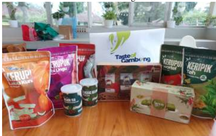
Gambar 5. Hasil Implementasi Desain pada Packaging

Hasil implementasi desain pada packaging produk Taste of Gombang menunjukkan perpaduan antara visual yang menarik dan penggunaan bahan kemasan yang berkualitas. Kemasan produk keripik, teh, dan camilan khas lainnya menggunakan plastik tebal yang menjaga keawetan produk serta dilengkapi dengan zipper lock untuk kemudahan penyimpanan. Warna-warna cerah seperti oranye, hijau, dan ungu pada kemasan keripik mencerminkan kesegaran dan daya tarik visual, sementara desain kemasan teh dalam kaleng memberikan kesan premium dan elegan. Selain itu, kotak untuk kue teh hijau dan paket oleh-oleh lainnya menggunakan bahan karton tebal yang ramah lingkungan, menegaskan komitmen pada keberlanjutan. Secara keseluruhan, desain ini tidak hanya fungsional tetapi juga memperkuat identitas produk dan meningkatkan nilai estetika produk oleh-oleh dari Desa Mekarsari Gombang.