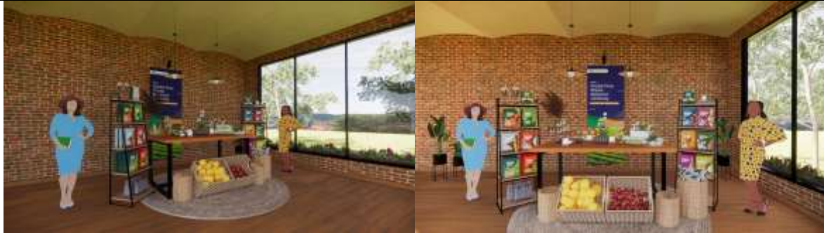
Gambar 4. Rancangan Corner Display Oleh-oleh