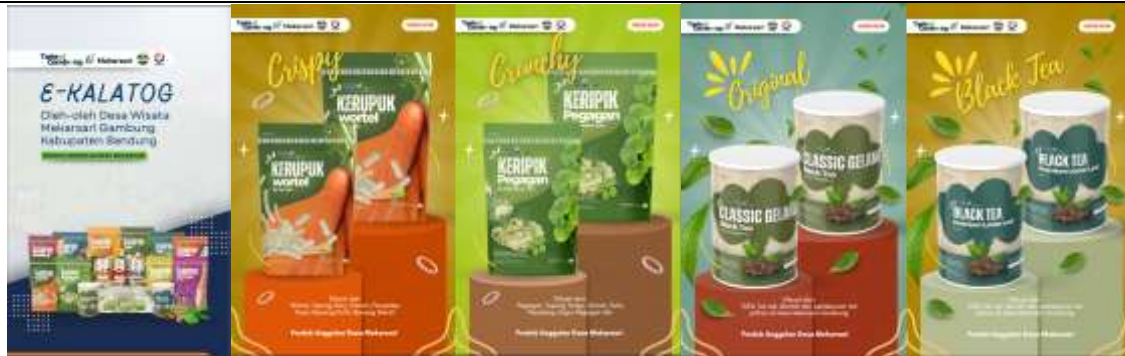
Gambar 6. E-Katalog Oleh-oleh Desa Wisata Mekarsari Gambung