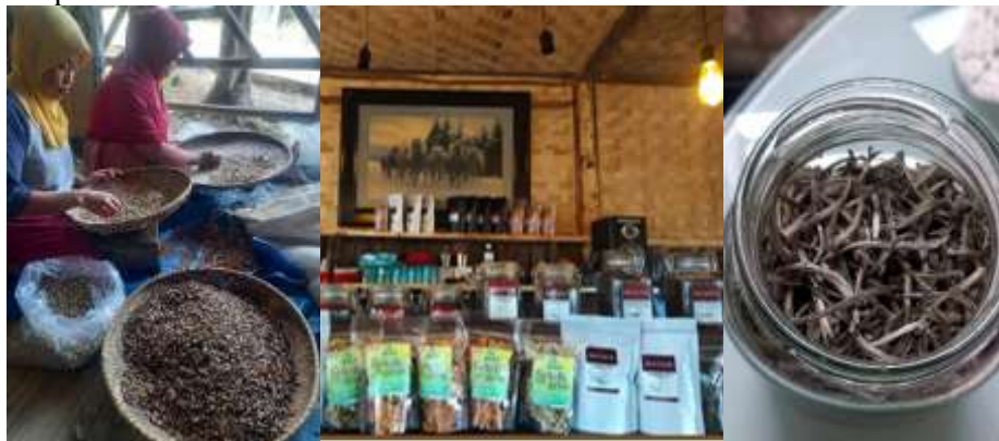
Gambar 3. Potensi oleh-oleh produk olahan masyarakat lokal

Pengunjung saat tiba di Desa Mekarsari Gambung sulit menemukan informasi terkait produk oleh-oleh desa. Pemasaran yang dilakukan selama ini bergantung bersifat word of mouth (WOM) dan mengandalkan saat pembelian paket wisata. Kondisi tersebut menggambarkan belum ada media khusus yang memvisualisasikan dan menginformasikan lengkap terpusat penawaran berbagai produk oleh-oleh desa. Saat ini kuliner juga menjadi tujuan utama aktivitas wisata, dengan adanya promosi yang baik dapat membuka peluang bahwa kegiatan pembelian oleh-oleh kuliner setempat menjadi tujuan utama dalam kedatangan wisatawan di Desa Gambung. Hal ini juga dapat membantu warga desa dalam menawarkan produk-produknya dengan lebih mudah kepada wisatawan.