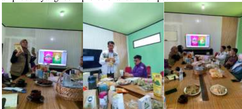
Gambar 1. Kegiatan Focus Group Discussion untuk Identifikasi Masalah dan Kebutuhan Mitra

Selain itu, FGD juga menggali kebutuhan spesifik untuk perancangan desain kemasan yang sesuai dengan karakteristik dan identitas desa. Peserta diskusi menyampaikan pentingnya desain kemasan yang tidak hanya menarik secara visual, tetapi juga mampu mencerminkan keunikan budaya dan alam Desa Mekarsari, serta mempertimbangkan faktor ramah lingkungan. Dari hasil FGD ini, didapatkan beberapa rekomendasi desain yang diharapkan dapat meningkatkan nilai jual produk, seperti penggunaan bahan kemasan yang lebih baik, elemen desain yang mencerminkan ikon desa, serta informasi produk yang lebih lengkap. Kegiatan ini menjadi langkah awal yang penting dalam menyusun perencanaan yang tepat untuk pengembangan UMKM desa melalui desain kemasan produk yang lebih profesional dan kompetitif.