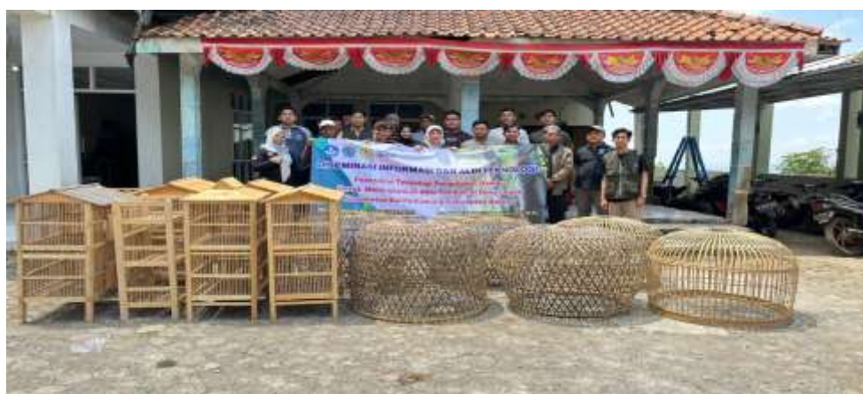
Gambar 5. Kegiatan Pelatihan Pembuatan Kerajinan Bambu Kurungan

Pendampingan dalam pembuatan produk kerajinan bambu bertujuan untuk meningkatkan keterampilan teknis pengrajin dengan memberikan bimbingan langsung dari ahli. Kegiatan ini mencakup pelatihan dalam teknik pemilihan bahan bambu yang tepat, penggunaan alat mekanik, dan metode pengolahan yang efisien. Pendamping juga memberikan arahan mengenai desain produk yang menarik dan cara-cara melakukan finishing yang berkualitas tinggi. Dengan bimbingan ini, pengrajin dapat memperbaiki proses produksi mereka, menghasilkan produk dengan standar yang lebih tinggi, dan memenuhi ekspektasi pasar. Selain itu, pendampingan juga mencakup pemecahan masalah teknis dan inovasi dalam desain, yang dapat meningkatkan daya saing produk kerajinan bambu.