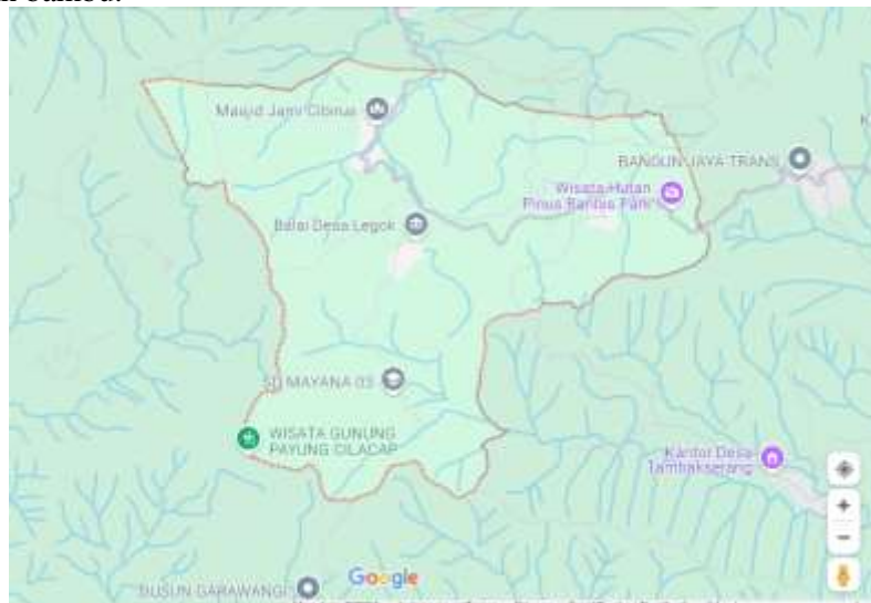
Gambar 2. Lokasi Pengabdian Kepada Masyarakat

Kegiatan Pengabdian Kepada Masyarakat ini dilakukan di Desa Legok, Kecamatan Bantarkawung, Kabupaten Brebes. Kegiatan ini di fokuskan untuk kelompok tani bambu didesa legok. Permasalahan yang dihadapi adalah masih kurang pahamiya pengetahuan para petani Bambu tentang potensi pengembangan UMKM Kerajinan Bambu untuk meningkatkan kesejahteraan para petani, bagaimana memperluas pangsa pasar, pengembangan branding serta meningkatkan keterampilan para petani bambu. Sehingga perlu dilakukan penyuluhan, pembuatan olahan bambu kurung, dan pendampingan yang dirancang untuk membekali para petani bambu dengan pengetahuan dan keterampilan yang diperlukan untuk dapat sukses dan berkembang dalam industri kerajinan bambu.