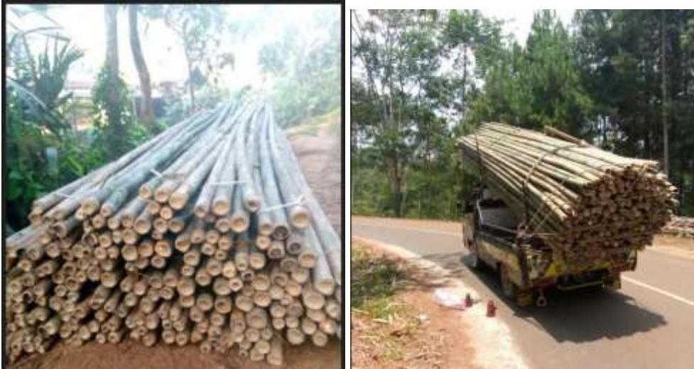
Gambar 1. Hasil produksi bambu dari Desa Legok Kecamatan Bantarkawung

Banyak warga yang menggantungkan hidupnya sebagai petani bambu padahal lebih dari 200 orang di dusun Cibirus, Legok memiliki perkebunan bambu. Perkebunan yang dimiliki warga rata-rata mampu menghasilkan 500 batang pohon bambu per hari nya. Namun yang terjadi selama ini, bambu yang dihasilkan dan terbilang melimpah itu hanya langsung dijual dalam bentuk bambu utuh saja. Jika dilihat dari tingkat penjualannya, setiap hari petani bambu di Desa Legok menjual bambu rata-rata 500 sampai dengan 1.000 batang ke Daerah Bumiayu dan Brebes dengan harga Rp 6.000,- per batang.