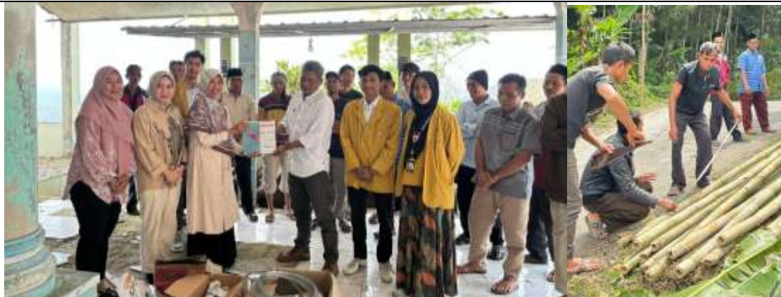
Gambar 4. Pemberian Alat dan Bahan untuk Peningkatan Keterampilan Kelompok Pengrajin