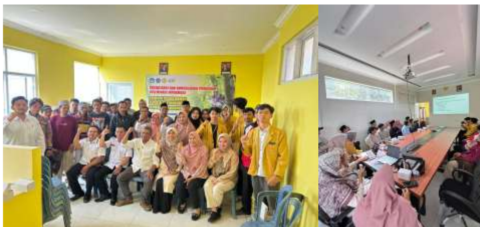
Gambar 3. Pelaksanaan Penyuluhan bagi Perajin Bambu Desa Legok

Kegiatan pengabdian kepada masyarakat ini dilaksanakan pada bulan Juli 2024 di Desa Legok dan melibatkan 25 peserta yang terdiri dari petani bambu dan anggota masyarakat. Kegiatan ini dimulai dengan memberikan penyuluhan, pembuatan kerajinan bambu, serta pembentukan dan pendampingan kelompok pengrajin bambu. Selama sesi penyuluhan, peserta menunjukkan antusiasme serta berpartisipasi aktif selama penyampaian materi. Materi yang disampaikan adalah prospek dari usaha kegiatan bambu, proses mengolah bambu menjadi kerajinan yang memiliki nilai tambah, pengetahuan mengenai pemasaran di era digital guna meningkatkan pangsa pasar melalui promosi sosial media.