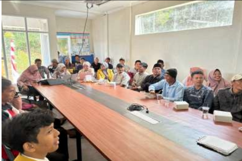
Gambar 6. Proses Pendampingan Perajin Bambu

Hasil kegiatan pengabdian masyarakat ini menunjukkan bahwa program ini memberikan dampak positif yang signifikan terhadap keterampilan dan pengetahuan perajin bambu. Perajin menjadi mengerti bagaimana mengolah sumber daya bambu menjadi hasil kerajinan yang dapat dijual dengan nilai ekonomis yang lebih tinggi. Menurut Hidayat, dkk. (2022), pemahaman yang lebih baik tentang nilai ekonomi bahan baku merupakan kunci untuk mendorong pengembangan usaha berbasis bahan baku lokal seperti bambu. Dalam kegiatan pembuatan produk kerajinan bambu, hasil yang diperoleh dari pengerjaan perajin desa Legok mencerminkan keberhasilan transfer keterampilan dari instruktur kepada perajin. Keterampilan penggunaan alat mekanik yang dipelajari secara langsung membantu peserta dalam memproduksi kerajinan dengan kualitas yang lebih baik, yang menunjukkan mengenai pentingnya pengalaman praktis dalam pelatihan keterampilan teknis.