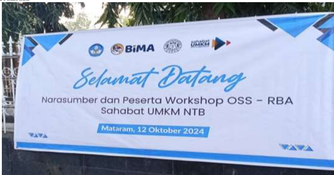
Gambar 1. Spanduk PkM

Permasalahan izin usaha merupakan hal yang perlu mendapat perhatian khusus di Kota Mataram. Berdasarkan hasil observasi dan wawancara langsung dengan Ketua Sahabat UMKM dan Pelaku Usaha, ternyata masih banyak pelaku usaha di Kota Mataram yang tidak memiliki izin usaha. Hal ini mengakibatkan beberapa dampak terhadap perkembangan UMKM di Kota Mataram, antara lain: Pelaku usaha yang tidak memiliki perlindungan hukum apabila usaha terlibat dalam suatu masalah, Pelaku usaha tidak dapat meminjam modal untuk mengembangkan usahanya menjadi lebih besar karena tidak memiliki izin usaha, Pelaku usaha tidak dapat ikut serta dalam program pelatihan dan pemberdayaan yang dilaksanakan oleh