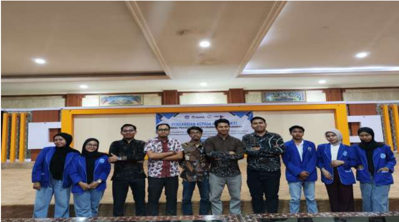
Gambar 1: Tim Pengabdian Universitas Bumigora

Dengan persiapan yang detail dan terkoordinasi ini, Tim Pengabdian Universitas Bumigora memastikan bahwa kegiatan pengabdian kepada masyarakat dapat berlangsung secara efisien dan mencapai hasil yang maksimal.