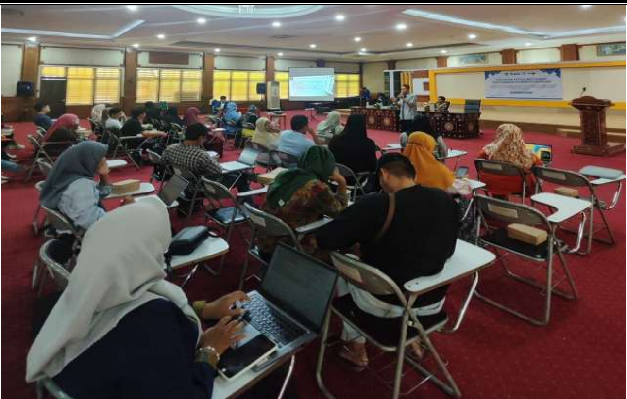
Gambar 4: Pelaksanaan Workshop hingga terbit 76 NIB

Selanjutnya Proses penerbitan izin usaha melalui Online Single Submission (OSS) dengan pendekatan berbasis risiko atau OSS-RBA terdiri dari beberapa tahapan yang dirancang untuk mempermudah pelaku usaha dalam memperoleh izin secara efisien dan terintegrasi. Berikut adalah alur dalam menerbitkan izin usaha melalui OSS: