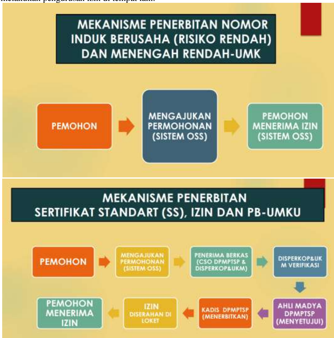
Gambar 5 : Mekanisme Penerbitan Sertifikat

Jika usaha memerlukan izin komersial atau operasional tambahan, seperti izin impor, izin distribusi, atau izin produksi, pelaku usaha dapat mengajukannya melalui OSS setelah NIB diterbitkan. Sistem OSS juga terintegrasi dengan berbagai kementerian dan lembaga, sehingga pelaku usaha tidak perlu melakukan pengurusan izin di tempat lain.