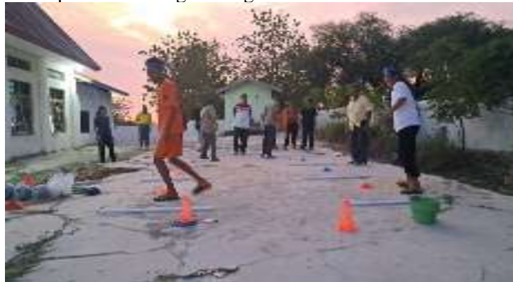
Gambar 4. Penentuan materi melalui model permainan dalam satu kelompok oleh masing-masing anggota

Pada tahapan ini, GMIT Faladelfia Oematnunu Desa Oematnunu akan dilatih kemampuan geraknya melalui permainan berbagai model bagian dalam dan punggung kaki. Anak-anak TK GMIT Narwastu berjumlah 20 orang yang terdiri dari 7 orang laki-laki dan 14 orang perempuan. Dari jumlah sampel tersebut dan sesuai dengan instrument pelaksanaan model ini, maka dibagikan dalam 2 kelompok. Setiap kelompok menentukan ketuanya untuk dapat melakukan permainan. Dalam Model permainan ini ada lima model yang di peragakan untuk para pemuda yang di latih terlebih dahulu oleh pelatih dalam menentukan materi yang akan dipraktekkan oleh kelompok tim masing-masing.