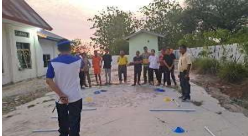
Gambar 2. Kegiatan Persiapan PKM