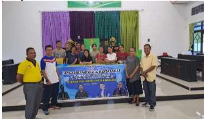
Gambar 1. Lokasi Pengabdian Kepada Masyarakat

Mencermati hasil analisis situasi dan keberadaan mitra serta diskusi bersama kedua mitra maka dapat dirumuskan permasalahan yang dihadapi mitra, adalah, yaitu: 1. Mitra anya menyelenggarakan program Latihan Dasar Kepemimpinan dalam bentuk ceramah 2. Mitra belum menerapkan bentuk pelatihan kepemimpinan berbasis outdoor activity untuk pemuda.