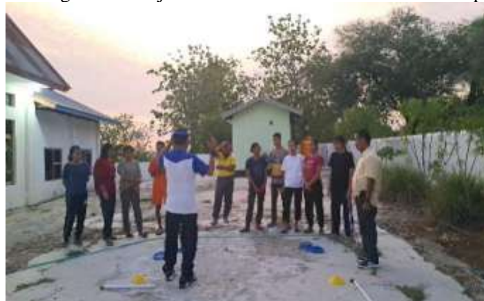
Gambar 3. Kegiatan Penyampaian Materi PKM

Tahapan ini akan diberikan edukasi tentang materi pelatihan leadership berbasis outdoor activity untuk pemuda. Cara memegang pipa yang berisi kelereng serta teknik membawanya sampai keujung titik finis dengan penuh kehati-hatian agar tidak terjatuh teknik melatih kosentrasi kekompakan dalam tim.