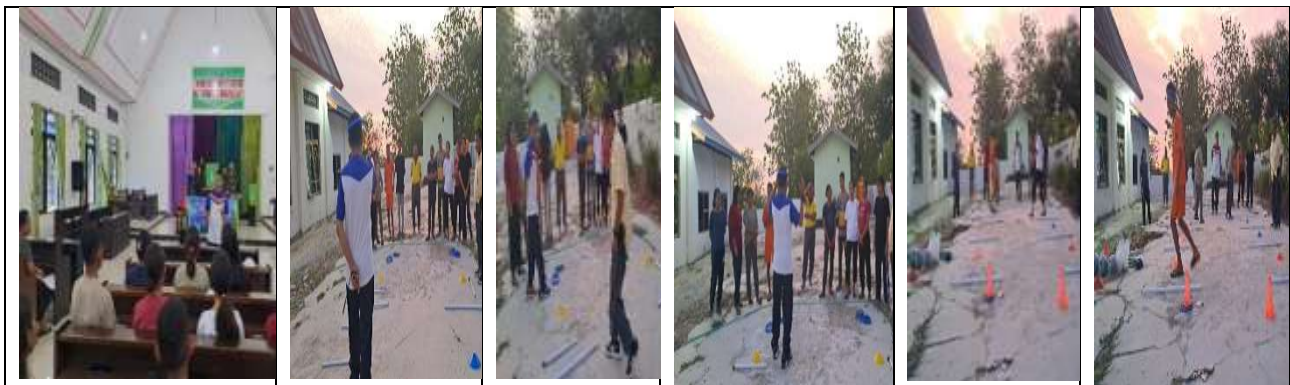
Gambar 5. Penjelasan awal serta Mempraktekkan Teknik dalam permainan yang telah dilakukan oleh masing-masing tim dalam kelompok

Setelah materi diketahui melalui permainan dari masing-masing model permainan, maka ketua kelompok menyampaikan ke anggota untuk mempraktekkannya. Setiap anggota kelompok harus mampu melaksanakan teknik membawa kelereng, bola plastik dan selang yang ada di kepala dan pingga yang diperoleh dari masing-masing tim dengan melewati rintangan kuns yang telah dipasangkan untuk memasukan bola ke keranjang yang telah di siapkan dipinggir lapangan disertai pengambilan waktu.