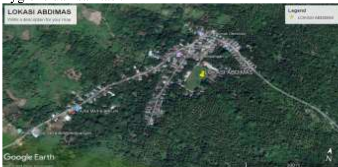
Gambar 1. Letak Lokasi Pengabdian Masyarakat (Kantor Desa)

Masalah utama yang dihadapi oleh Desa Wisata Balang Butung, adalah kurangnya fasilitas dan layanan wisata yang memadai, yang dapat menghambat potensi desa tersebut sebagai destinasi wisata unggulan. Meskipun Desa Wisata Balang Butung memiliki daya tarik alam dan budaya yang unik, terdapat berbagai tantangan yang perlu diatasi. Salah satunya adalah keterbatasan infrastruktur yang mencakup aksesibilitas dan kualitas infrastruktur pendukung wisata, seperti transportasi, komunikasi, serta fasilitas sanitasi dan akomodasi (homestay) yang masih perlu ditingkatkan. Selain itu, keterampilan sumber daya manusia (SDM) lokal juga masih terbatas, di mana banyak pengelola homestay dan pemandu wisata belum memiliki pengetahuan dan keterampilan yang memadai, terutama terkait standar layanan wisata serta pengelolaan hygiene dan sanitasi.