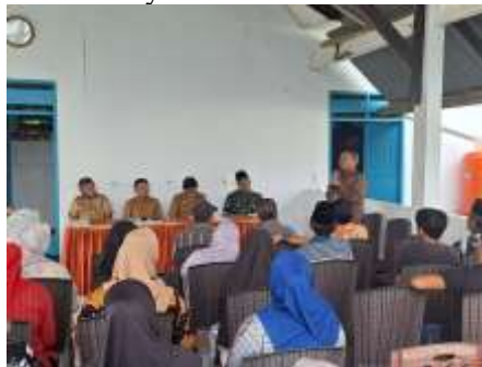
Gambar 5. Pemaparan Pemasaran Homestay

Penelitian ini menemukan bahwa akses Wi-Fi yang cepat dan gratis menjadi salah satu fasilitas penting yang diharapkan tamu saat menginap di homestay. Selain itu, penyediaan TV dengan saluran kabel dan opsi hiburan lain seperti layanan streaming memberikan pengalaman menginap yang lebih menyenangkan. Keberadaan colokan listrik yang cukup dan port USB juga sangat membantu tamu dalam memenuhi kebutuhan teknologi mereka. Masyarakat Desa Wisata Balang Butung tidak hanya mampu menyediakan fasilitas dasar yang memadai, tetapi juga berhasil meningkatkan standar fasilitas homestay ke tingkat yang lebih profesional. Pelatihan dan penyuluhan yang telah diterima oleh masyarakat berperan besar dalam membentuk pemahaman mereka mengenai pentingnya kebersihan, keamanan, kenyamanan, dan estetika dalam meningkatkan kualitas layanan homestay.