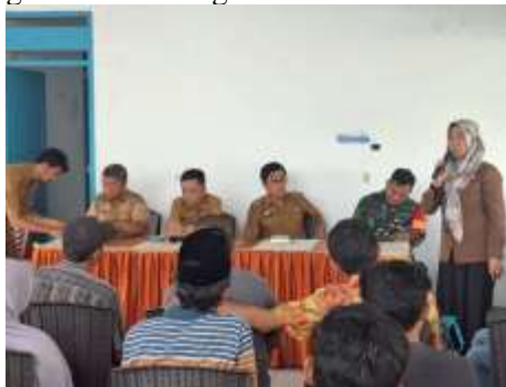
Gambar 4. Pemaparan Materi Hygiene dan Sanitasi

Hasil dari studi ini dengan jelas menunjukkan bahwa pelaksanaan pelatihan hygiene dan sanitasi di Desa Wisata Balang Butung telah memberikan dampak yang positif terhadap peningkatan kualitas pengelolaan homestay di desa tersebut. Masyarakat setempat, terutama para pengelola homestay, telah menunjukkan peningkatan kesadaran dan pengetahuan yang signifikan terkait pentingnya menjaga kebersihan diri dan lingkungan, yang pada akhirnya akan berkontribusi pada kenyamanan dan keamanan wisatawan. Penelitian ini juga menegaskan bahwa penerapan standar hygiene dan sanitasi yang baik sangat penting untuk menjaga daya tarik pariwisata di Desa Wisata Balang Butung. Dengan adanya program pelatihan yang intensif, masyarakat telah memahami bagaimana praktik-praktik kebersihan yang baik, seperti pengelolaan sampah, daur ulang, komposting, dan pengelolaan air limbah, dapat meningkatkan kualitas lingkungan sekitar homestay serta menjaga kesehatan wisatawan dan penduduk lokal. Penerapan hygiene dan sanitasi yang baik, didukung oleh peningkatan infrastruktur dan sumber daya manusia yang kompeten, adalah kunci untuk menciptakan destinasi wisata yang berkelanjutan dan menarik. Dengan begitu, Desa Wisata Balang Butung dapat terus berkembang sebagai salah satu destinasi wisata unggulan di Kabupaten Kepulauan Selayar, sekaligus meningkatkan kesejahteraan masyarakat setempat melalui peningkatan kualitas layanan wisata dan lingkungan yang bersih serta higienis.