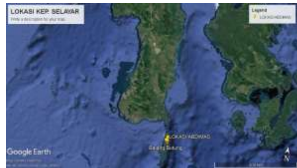
Gambar 2. Letak Lokasi Kegiatan di Provinsi Sulawesi Selatan