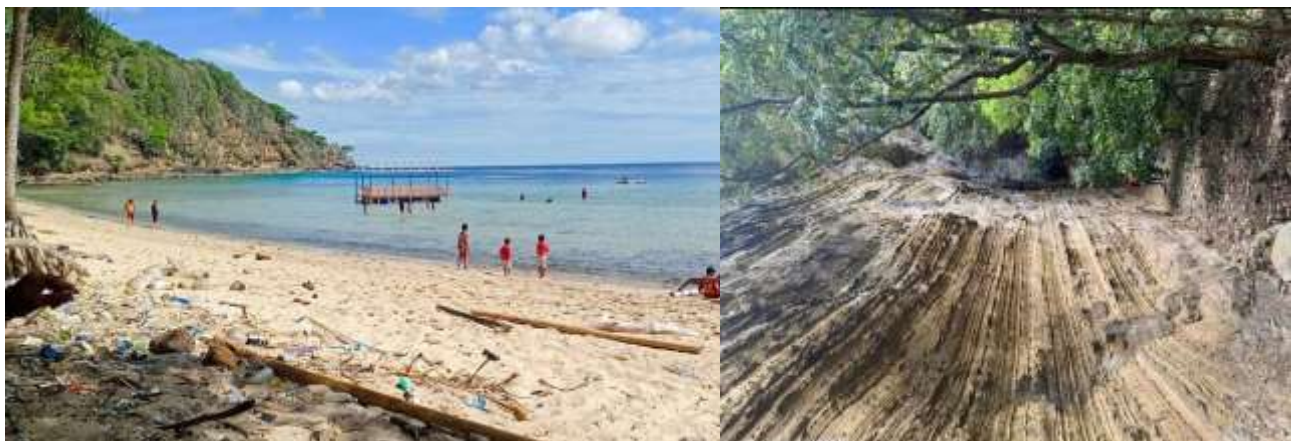
Gambar 3. Atraksi Wisata Desa Balang Butung

Desa wisata ini juga menghadapi tantangan dalam menarik wisatawan internasional, karena keterbatasan dalam pemasaran dan promosi digital yang masih kurang optimal, sehingga sebagian besar pengunjung berasal dari wisatawan lokal. Selain itu, data kunjungan wisatawan menunjukkan adanya fluktuasi yang