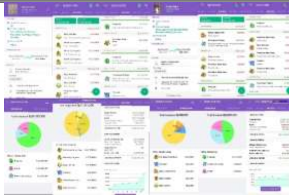
Gambar 7: Hasil Pencatatan UMKM Santoz Craft Gambar 8: Hasil Pencatatan UMKM Annisa Rajut

Hasil laporan keuangan tersebut dapat memperlihatkan total pemasukan, pengeluaran, dan laba atau rugi selama bulan Agustus 2024. Hasil laporan keuangan tersebut dapat mempermudah pelaku UMKM untuk melihat tingkat kesuksesan usahanya dan sebagai acuan dalam pengambilan keputusan.