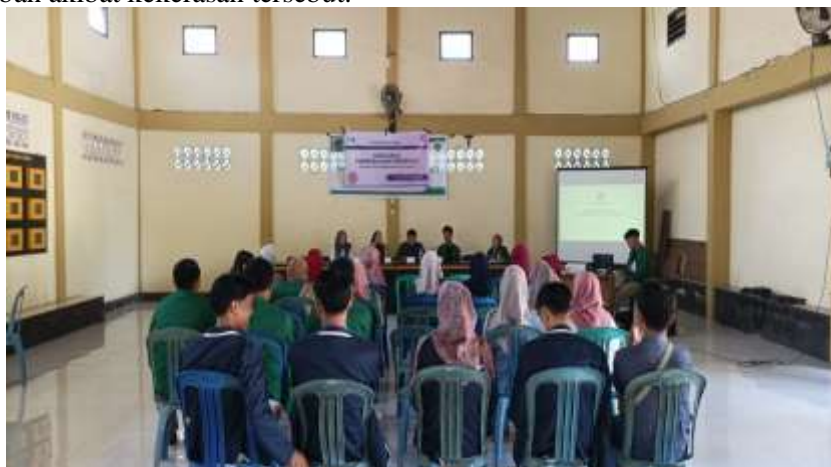
Gambar 4. Dokumentasi Kegiatan Sosialisasi Sedang Berlangsung dan Seluruh Tamu Undangan Mendengarkan Dengan Baik

Materi yang disampaikan langsung oleh Tim Lombok Research Center (LRC) diawali dengan memberikan contoh berbagai peristiwa kekerasan yang terjadi kepada kaum perempuan dan anak di Kabupaten Lombok Timur. Kemudian Pembicara menyampaikan dampak yang banyak di alami dan dirasakan oleh korban akibat kekerasan tersebut.