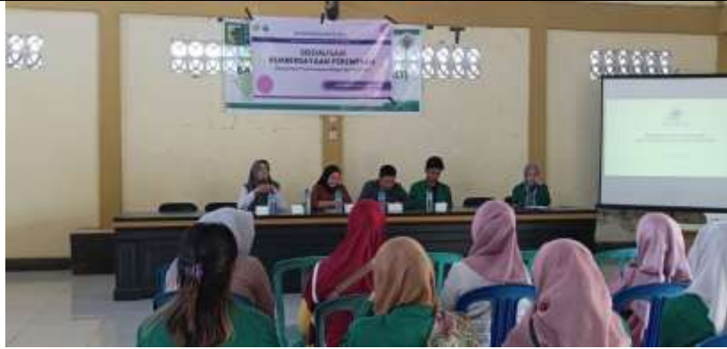
Gambar 5. Dokumentasi Kegiatan Sosialisasi Oleh Tim PKM beserta Seluruh Para Tamu Undangan yang Mengajukan Pertanyaan dan Pertanyaan dijawab Langsung Oleh Pemateri

Kegiatan pengabdian ini diakhiri dengan kegiatan tanya jawab antara para tamu undangan dengan Tim Lombok Research Center (LRC) sebagai Pembicara/pemateri. Mahasiswa dan para tamu undangan begitu antusias bertanya dan meminta bagaimana cara menghindarinya jika hal demikian terjadi pada anggota keluarga atau lingkungan sekitar.