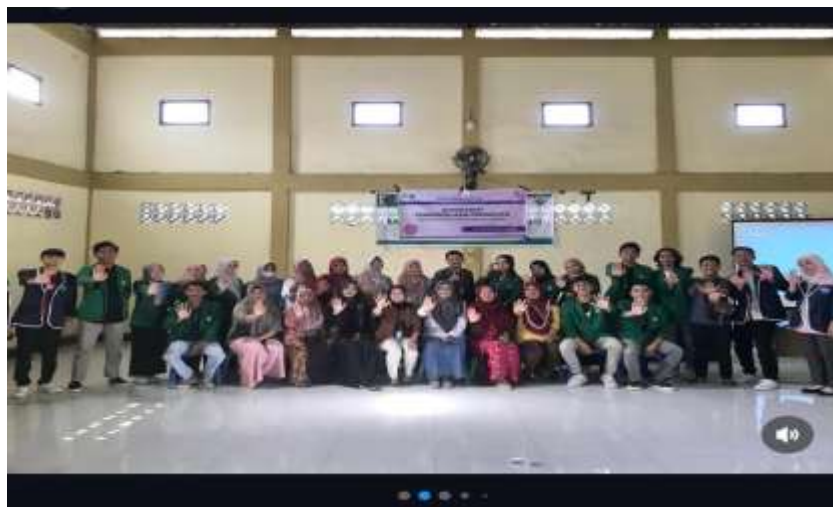
Gambar 6. Foto Bersama Tim PKM dengan Pembicara dan Seluruh Tamu Undangan Usai Kegiatan Sosialisasi.

Kegiatan pengabdian ini diakhiri dengan kegiatan tanya jawab antara para tamu undangan dengan Tim Lombok Research Center (LRC) sebagai Pembicara/pemateri. Mahasiswa dan para tamu undangan begitu antusias bertanya dan meminta bagaimana cara menghindarinya jika hal demikian terjadi pada anggota keluarga atau lingkungan sekitar.