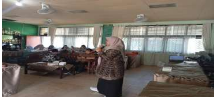
Gambar 2. Pemateri menyampaikan materi pembekalan kinerja guru

Menurut pendapat Fahmy yang dikutip Hafidulloh dkk (2021) bahwa guru harus memiliki peran dan kepribadian yang unik, baik, mantap, stabil dewasa, arif, berwibawa, serta dapat menjadi teladan yang baik untuk anak didiknya. Dalam hal ini guru harus berkepribadian ganda yakni harus bersikap empati, kritis dan sabar terhadap anak didiknya. Peserta juga diberikan pemahaman terkait kemampuan guru dalam melaksanakan tugasnya sehingga dapat menghasilkan hasil kerja yang memuaskan sebagai upaya mencapai tujuan dari pada oraganisasi pada unit kerjanya.