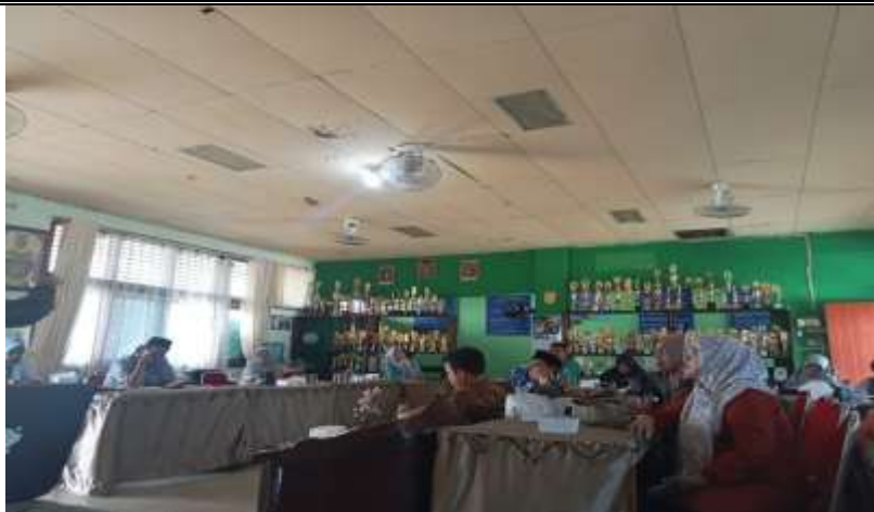
Gambar 4. Forum Diskusi dan Tanya Jawab yang Interaktif antara Pemateri dan Peserta Kegiatan

Diakhir kegiatan, seluruh tim Pengabdian kepada Masyarakat UIN Sulthan Thaha Saifuddin Jambi melakukan foto Bersama sebagai bentuk keakraban bisa membantu mempererat rasa kekeluargaan dengan peserta guru-guru dan tenaga administrasi di Madrasah Aliyah Laboratorium Swasta Kota Jambi.