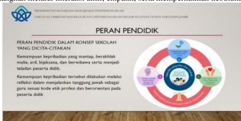
Gambar 3. Salah Satu Materi yang Disajikan kepada peserta

Peran guru dalam konsep sekolah yang dicita-citakan tersebut menurut Mulyasa dalam (Nurzannah, 2022) yakni guru harus memiliki kestabilan emosi, ingin memajukan peserta didik, bersikap realitas, jujur dan terbuka, teliti, rajin memiliki kepribadian yang mantap, menguasai ilmu kepemimpinan, mampu berkomunikasi dan menjaga hubungan baik antar manusia, memahami strategi dan manajemen pendidikan serta peka terhadap perkembangan, terutama inovasi pendidikan. Pemateri memberikan gambaran-gambaran umum yang relevan dengan dunia pendidikan yang terjadi saat ini, bahwa masih banyak guru yang belum memahami dan mengaplikasikan terkait tugas dan perannya sebagai pendidik, pengajar, pemimpin dan manager di kelas sehingga menimbulkan kurangnya motivasi siswa dalam proses pembelajaran. pada penyampaian materinya, pemateri menjelaskan bahwa perlunya diterapkan pembelajaran yang berpusat pada siswa melalui manajemen kelas yang baik., maksudnya pendidik mampu menyediakan pembelajaran yang efektif dan menyenangkan melalui interaksi aktif, empatik, serta memperhatikan kebutuhan belajar siswa.