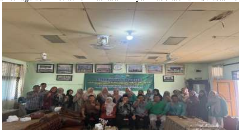
Gambar 5. Di akhir Kegiatan Dilakukan Foto Bersama Pemateri dan Peserta

Diakhir kegiatan, seluruh tim Pengabdian kepada Masyarakat UIN Sulthan Thaha Saifuddin Jambi melakukan foto Bersama sebagai bentuk keakraban bisa membantu mempererat rasa kekeluargaan dengan peserta guru-guru dan tenaga administrasi di Madrasah Aliyah Laboratorium Swasta Kota Jambi.