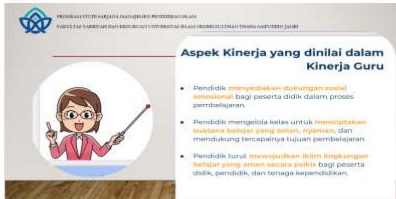
Gambar 3. Materi yang disampaikan oleh pemateri dalam power point yang disediakan

Pada saat kegiatan berlangsung, ketika pemateri menyampaikan uraian secara detail tentang poin-poin yang ditampilkan pada power point . Peserta terlihat sangat antusias dan respon positif dari masing masing peserta ditunjukkan dengan keseriusan dalam mendengarkan dan memperhatikan apa yang disampaikan. Suasana terlihat rilek tapi serius karena pemateri mampu menguasai ruangan dan memahami apa yang diinginkan oleh peserta pelatihan. Peserta terlihat mendengarkan bahkan ada beberapa yang mencatat poin-poin yang dianggap penting dan ditanyakan secara langsung jika kurang memahami dari apa yang disampaikan oleh pemateri.