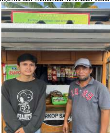
Gambar 1. UMKM Angkringan Istimewa

Masalah dalam pengabdian masyarakat ini adalah pelaku UMKM yang belum pernah menyusun laporan keuangan dan kurang memahami konsep serta pentingnya laporan keuangan sederhana, yang mengakibatkan kesulitan dalam mengelola dan memantau kesehatan keuangan usaha mereka.