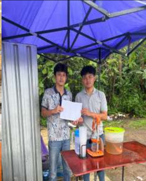
Gambar 4. UMKM Teh Poci

Beberapa alasan mengapa penting untuk membuat catatan keuangan sendiri antara lain: 1) Memahami jalannya operasional bisnis; 2) Memiliki kemampuan untuk memantau pengeluaran biaya bisnis; 3) Mendapatkan informasi terkait utang dan piutang; dan 4) Mengurangi atau menghindari risiko kehilangan aset, uang, atau barang. Dengan adanya pembukuan yang baik, bisnis dapat lebih mudah mengoptimalkan keuntungan. Manfaat dari pencatatan keuangan adalah memungkinkan UMKM Angkringan Istimewa dan Teh Poci di Kecamatan Sedayu untuk melaporkan keuntungan atau kerugian mereka dengan jelas, berdasarkan catatan setiap transaksi yang dilakukan. Selain itu, ini mempermudah proses pelaporan secara keseluruhan dan membantu pemilik usaha memahami pentingnya memisahkan keuangan pribadi dan bisnis. Banyak pelaku UMKM yang mengalami kerugian karena sering mencampuradukkan uang pribadi dengan uang bisnis, yang pada akhirnya menghambat pencapaian keuntungan usaha.