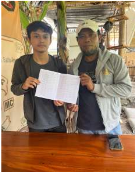
Gambar 3. UMKM Angkringan Istimewa