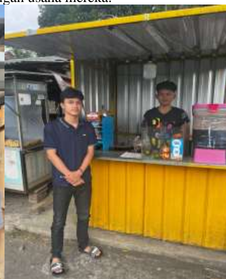
Gambar 2. UMKM Teh Poci