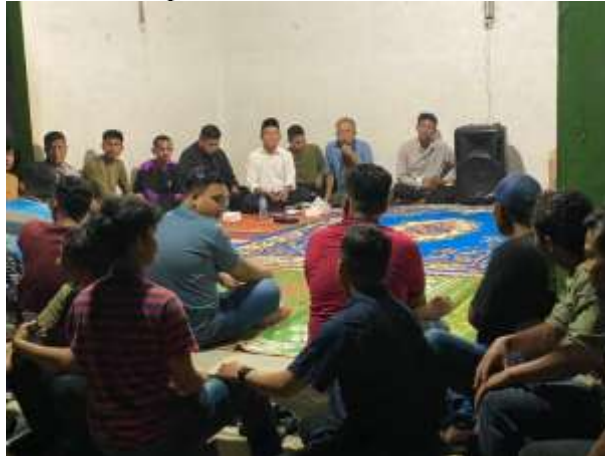
Gambar 1. Pembentukan Kelompok Sebaya Remaja dipandu oleh Ketua Tim

Dalam kegiatan pembentukan kelompok sebaya untuk mendampingi remaja terkait masalah narkoba dan rokok serta masalah lainnya yang ada di Masyarakat (sampah, dlsb) di Desa Sena, pelaksanaan dilakukan melalui serangkaian metode yang dirancang untuk mencapai tujuan spesifik. Kegiatan ini menggunakan metode seperti ceramah dan diskusi kelompok.