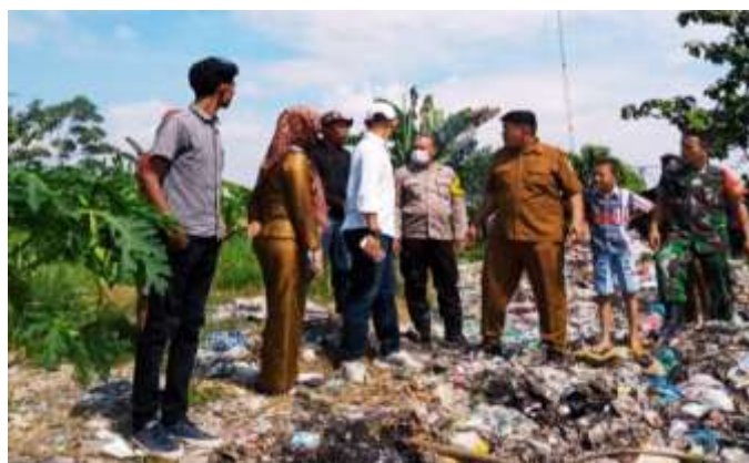
Gambar 4. Pimpinan Remaja Berkordinasi dengan Kepala Desa dalam Pengurusan Permasalahan Sampah di Desa Sena

Cara Pelaksanaan dan Pencapaian Tujuan, Kegiatan pendampingan ini dilakukan melalui beberapa langkah strategis sebagai berikut, 1).Diskusi Intensif dengan remaja tentang pentingnya pengelolaan sampah dan metode yang efektif untuk melakukannya. 2)Bekerja sama dengan remaja untuk merancang dan menerapkan sistem pengelolaan sampah yang efisien yang melibatkan pemilahan dan pengolahan sampah. 3)Melibatkan pemerintah desa untuk mendukung sistem pengelolaan sampah, baik dari segi sumber daya maupun kebijakan. Indikator Keberhasilan yang terjadi yaitu, jumlah remaja yang terlibat aktif dalam program dan aktivitas yang berkelanjutan. Selain itu adanya tingkat dukungan dari komunitas dan pemerintah desa terhadap program ini.