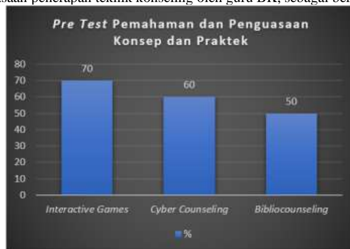
Gambar 3. Hasil Pre Test Pemahaman dan Penguasaan Konsep dan Praktek

Berdasarkan hasil koordinasi tahap I dengan menyebarkan instrumen untuk mengetahui tingkat penguasaan guru BK terhadap penerapan konseling menggunakan teknik, maka diketahui tingkat pemahaman dan penguasaan penerapan teknik konseling oleh guru BK, sebagai berikut ini.