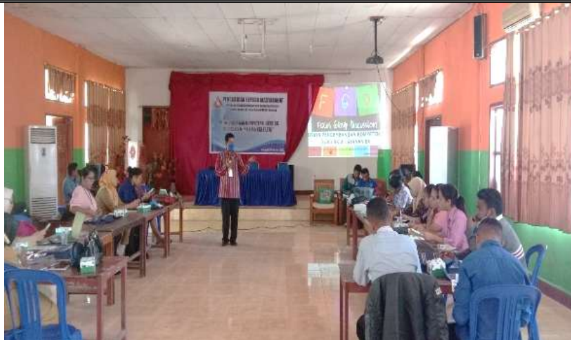
Gambar 5. Kegiatan Focus Group Discussions Secara Luring

Analisis diskusi pada kegiatan FGD dilakukan secara komprehensif dan terbuka, dengan hasil analisis :