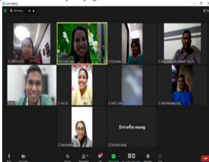
Gambar 4. Kegiatan FGD secara Daring

Adapun koordinasi tahap II melalui Focus Group Discussion (FGD) dengan pengurus MGBK Kabupaten Alor secara daring dan bersama peserta kegiatan secara luring. Tahap pertama kegiatan FGD, secara luring melalui platform Zoom bersama guru-guru BK. Diketahui bahwa guru BK sangat terbatas dalam akses pengembangan profesional peningkatan wawasan teknik konseling karena faktor internal terkait akses dana dan juga keterbatasan sarana penunjang.