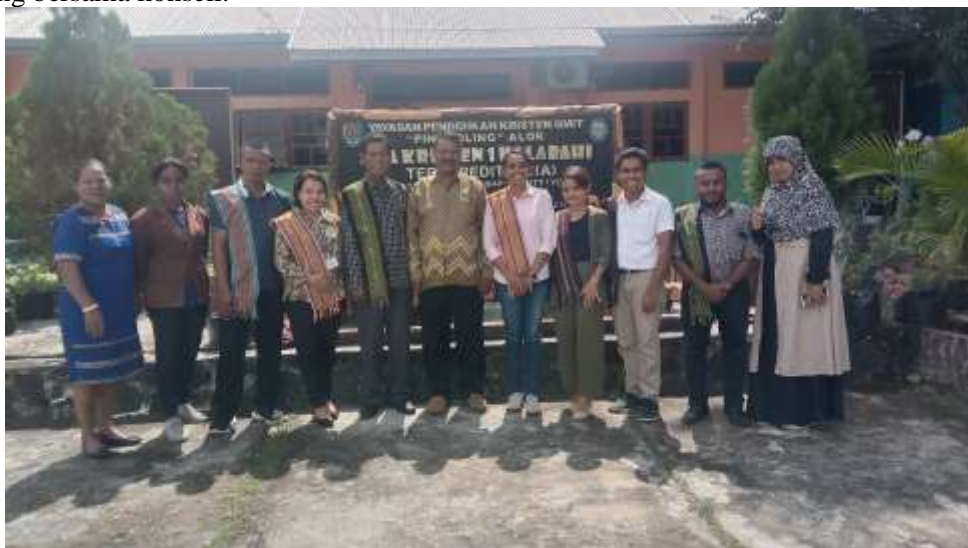
Gambar 2. Tim PkM bersama Pengurus MGBK dan Kepala Sekolah di Lokasi PkM, SMA Kristen 1 Kalabahi, Kabupaten Alor, Propinsi Nusa Tenggara Timur

Pada kenyataannya, masih terdapat hambatan guru bimbingan dan konseling dalam mengupayakan pengembangan kompetensi yang dimaksud. Dampaknya, guru BK terbatas dan keliru dalam membina dan memelihara proses psikologis, emosional, hubungan interpersonal, pemecahan masalah, dan penetapan tujuan konseling bersama konseli.