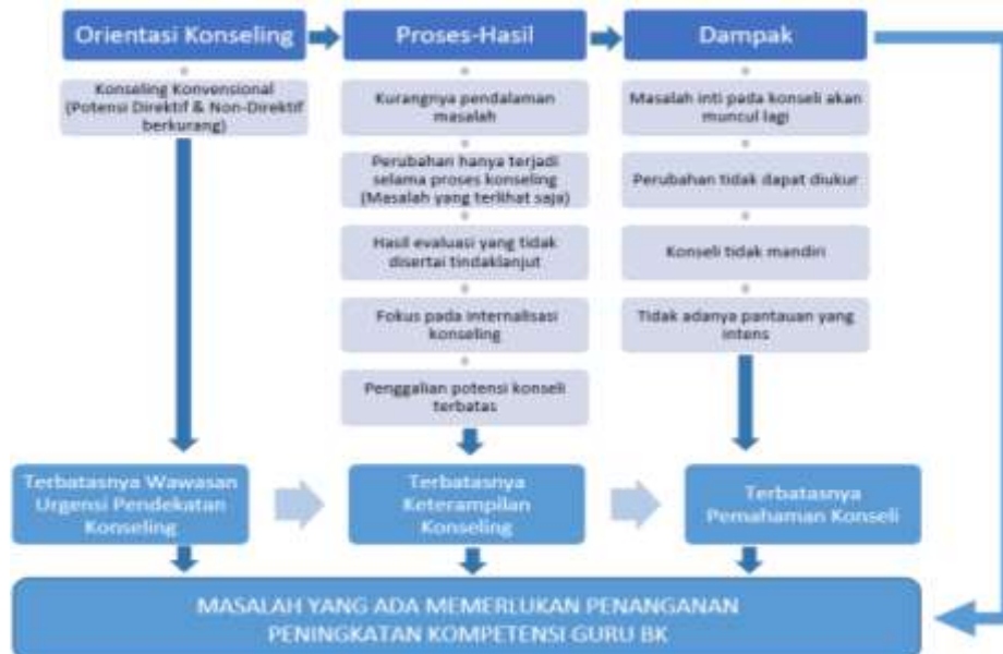
Gambar 1. Skema Permasalahan Kompetensi Guru BK

Pada kenyataannya, masih terdapat hambatan guru bimbingan dan konseling dalam mengupayakan pengembangan kompetensi yang dimaksud. Dampaknya, guru BK terbatas dan keliru dalam membina dan memelihara proses psikologis, emosional, hubungan interpersonal, pemecahan masalah, dan penetapan tujuan konseling bersama konseli.