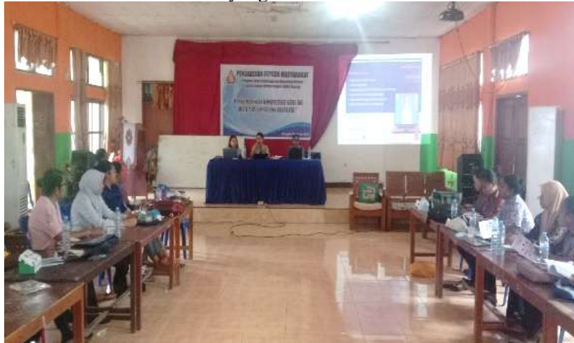
Gambar 7. Diskusi Simulasi antar peserta dan pemateri melalui media BK

diberikan kesempatan untuk mengakses internet melalui laptop dan menggunakan platform media sosial seperti facebook untuk mulai menerapkan cybercounseling dengan memperhatikan karakteristik media sosial yang digunakan dan keterbatasan media sosial yang ada.