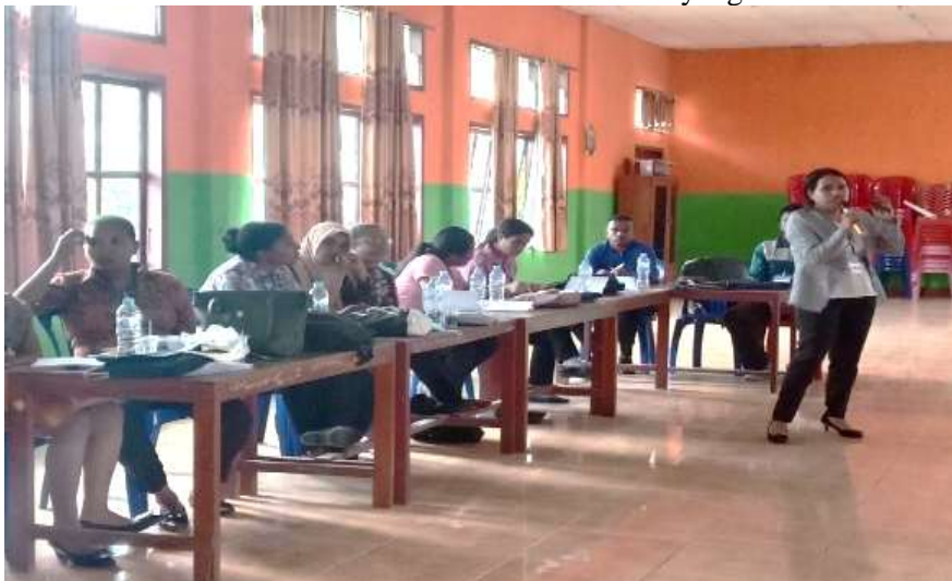
Gambar 8. Simulasi bibliocounseling dalam konseling antara para peserta dan pemateri

Materi ketiga tentang pelatihan bibliocounseling . Para peserta diarahkan untuk mengembangkan ketertarikan literasi dalam membaca dan menganalisis karakteristik bacaan yang ada. Peserta tampak antusias mengumpulkan sejumlah referensi buku dan video inspiratif sebagai bahan materials . Referensi tersebut diberikan coding permasalahan berdasarkan sinopsis cerita atau rangkuman video yang ada, dengan menekankan pada karakteristik tokoh utama dalam bacaan atau video yang ada.