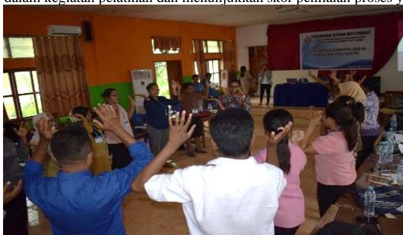
Gambar 6. Simulasi salah satu Interactive Games dalam BK

Pelaksanaan tahap ini dilakukannya serangkaian pelatihan konseling eklektik dalam Seminar Panel. Materi Pelatihan yang pertama adalah, Interactive Games . Pelatihan menkankan akan keterlibatan aktif peserta dalam kerja kelompok ( group work ). Adapun masing-masing peserta diminta untuk menguasai jenis permainan, tujuannya dan cara praktisnya sehingga tidak menimbulkan kejenuhan dalam penerapannya. Para peserta tampak aktif dalam kegiatan pelatihan dan menunjukkan skor penilaian proses yang tinggi.