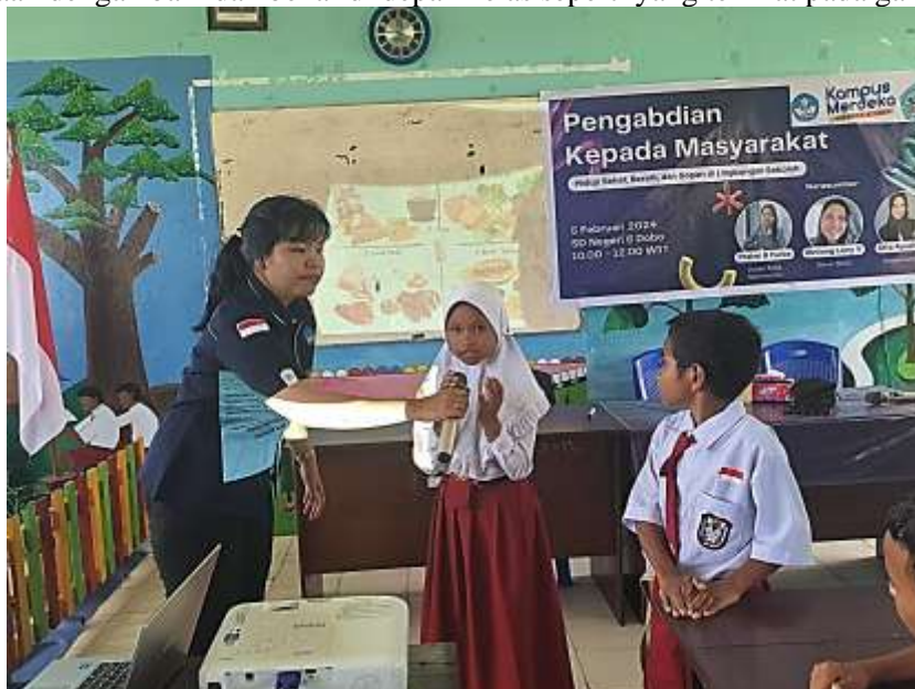
Gambar 4. Siswa Menjawab Pertanyaan yang Diajukan Narasumber

Setelah pemaparan materi selesai, narasumber melakukan tanya jawab dengan siswa mengenai materi yang baru saja dipaparkan. Pertanyaan yang diajukan seputar komposisi makanan sehat. Siswa mampu menjawab pertanyaan dengan baik dan benar di depan kelas seperti yang terlihat pada gambar berikut.