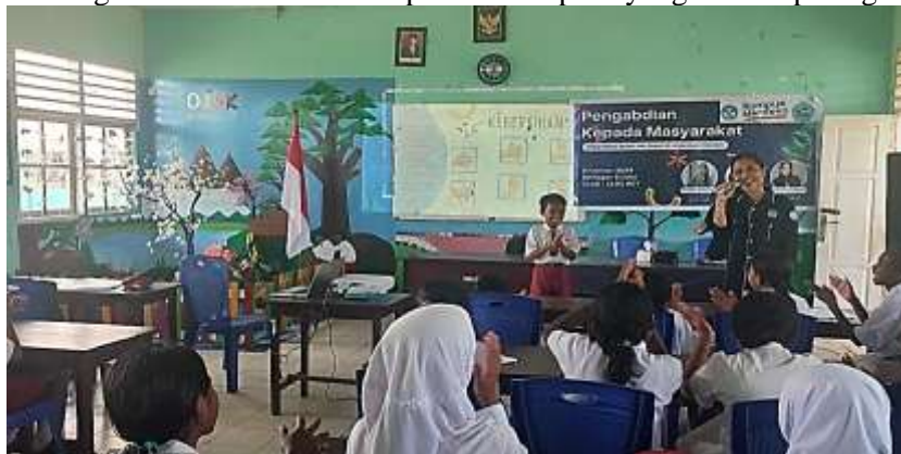
Gambar 2. Siswa Menjawab Pertanyaan yang Diajukan Narasumber

Setelah pemaparan materi selesai, narasumber melakukan tanya jawab dengan siswa mengenai materi yang baru saja dipaparkan. Pertanyaan yang diajukan seputar cara mencuci tangan yang benar. Siswa mampu menjawab pertanyaan dengan baik dan benar di depan kelas seperti yang terlihat pada gambar berikut.