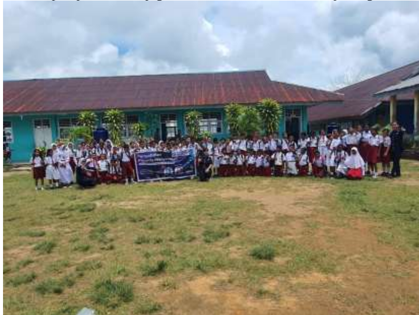
Gambar 10. Foto Bersama Siswa Bersama Narasumber Usai Kegiatan Pengabdian Kepada Masyarakat