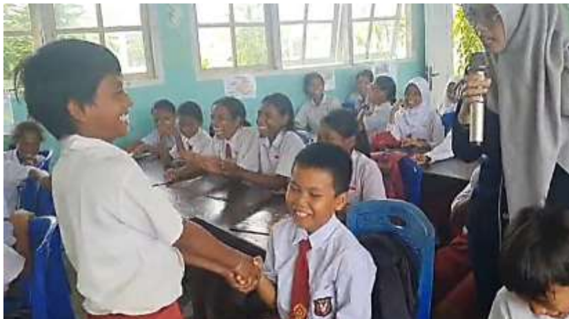
Gambar 8. Siswa Berdamai sebagai Bentuk Penerapan 5S

Narasumber mengajak siswa yang berselisih paham dengan temannya untuk saling berdamai sebagai bentuk penerapan 5S dalam lingkungan sekolah. Siswa bersedia untuk berdamai dengan temannya. Mereka berjanji untuk tidak melakukannya lagi dan mau bersikap sopan dan santun di lingkungan sekolah seperti yang terlihat pada gambar berikut.