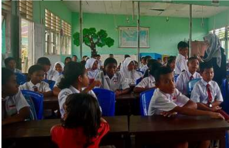
Gambar 7. Siswa Menjawab Pertanyaan yang Diajukan Narasumber

terima jika mereka melakukan perundingan. Siswa mampu menjawab pertanyaan dengan baik dan benar di depan kelas seperti yang terlihat pada gambar berikut.