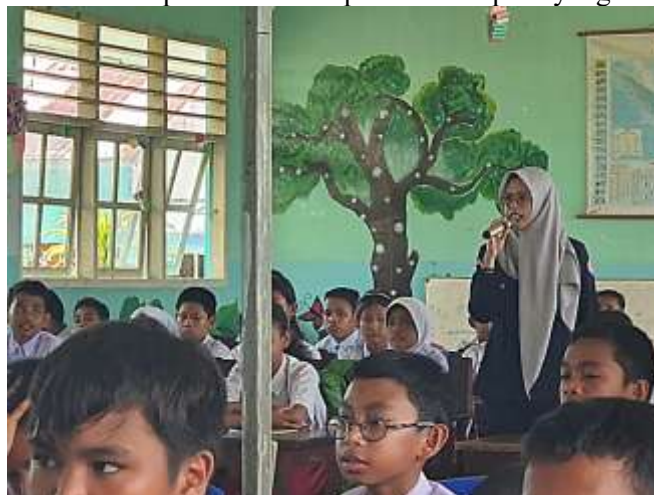
Gambar 6. Narasumber Memaparkan Materi

Selain itu Narasumber juga memaparkan mengenai perundungan ( Bullying ) di lingkungan sekolah. Narasumber juga mengaitkannya dengan dasar hukum yang berlaku yaitu UU Nomor 35 Tahun 2014 tentang Perubahan atas UU Nomor 23 Tahun 2002 tentang Perlindungan Anak Pasal 76C yang berbunyi: "Dilarang menempatkan, membiarkan, melakukan menyuruh, melakukan atau turut serta melakukan kekerasan terhadap anak. Setiap yang melanggar ketentuan sanksi pidana penjara paling lama 3 tahun 6 bulan dan/atau denda maksimal Rp72.000.000". Materi disampaikan melalui presentasi seperti yang terlihat pada gambar berikut.