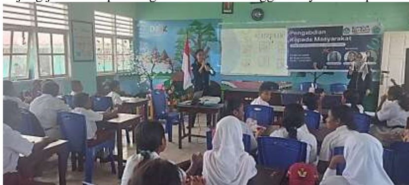
Gambar 1. Narasumber Memaparkan Materi

Setelah pemaparan materi selesai, narasumber melakukan tanya jawab dengan siswa mengenai materi yang baru saja dipaparkan. Pertanyaan yang diajukan seputar cara mencuci tangan yang benar. Siswa mampu menjawab pertanyaan dengan baik dan benar di depan kelas seperti yang terlihat pada gambar berikut.