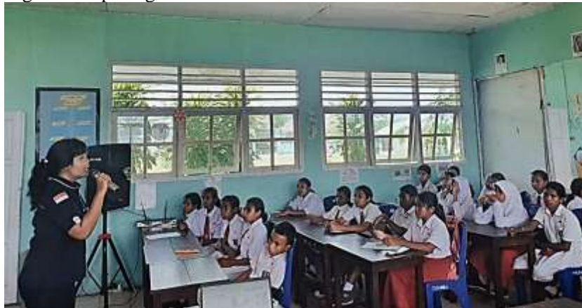
Gambar 3. Narasumber Memaparkan Materi

seimbang. Peningkatan pengetahuan tentang makanan sehat juga berpengaruh terhadap peningkatan pengetahuan yang dapat diamati melalui peningkatan hasil belajar peserta didik (Cahyani, 2022). Menjaga kesehatan juga dapat dilakukan dengan melakukan olah raga secara teratur. Materi disampaikan melalui presentasi seperti yang terlihat pada gambar berikut