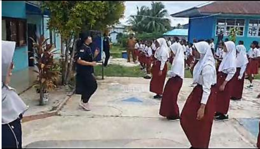
Gambar 5. Siswa Melakukan Olah Raga Bersama