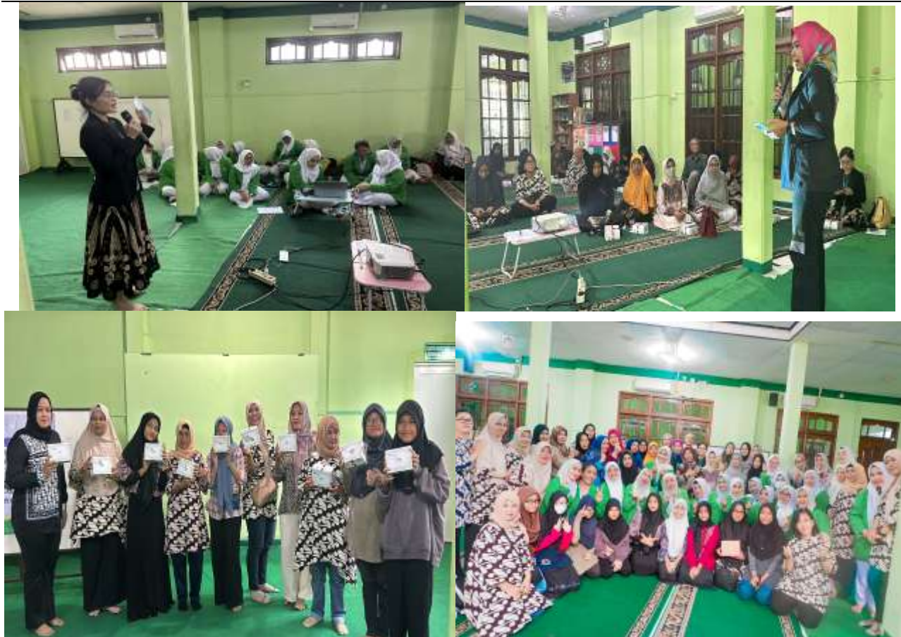
Gambar 1. Kegiatan PkM dan Foto bersama