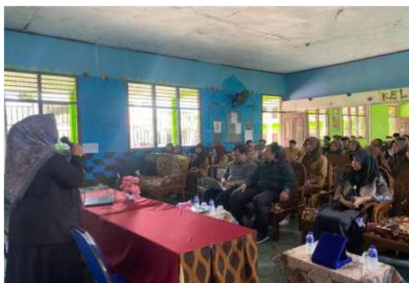
Gambar 3. Penyampaian Materi dan Sesi Tanya Jawab Pengabdian Masyarakat