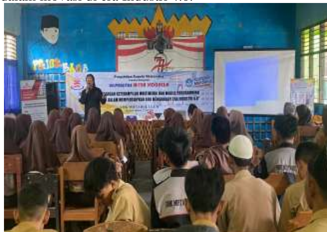
Gambar 2. Pembukaan Pengabdian Masyarakat

Secara keseluruhan, pelatihan ini memberikan hasil yang positif dan menjadi langkah awal dalam membangun kompetensi digital siswa SMK Miftahul Ulum. Keberlanjutan program ini, baik melalui pelatihan lanjutan maupun integrasi dalam kurikulum, sangat penting untuk memastikan siswa siap menghadapi tuntutan dunia kerja di era transformasi digital (Siska, R., & Iman, 2023). Dengan pengembangan berkelanjutan, siswa tidak hanya mampu mengikuti perkembangan teknologi, tetapi juga berkontribusi secara aktif dalam inovasi di era Industri 4.0.