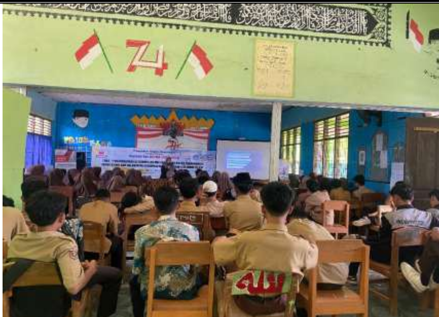
Gambar 4. Penutupan Pengabdian Masyarakat