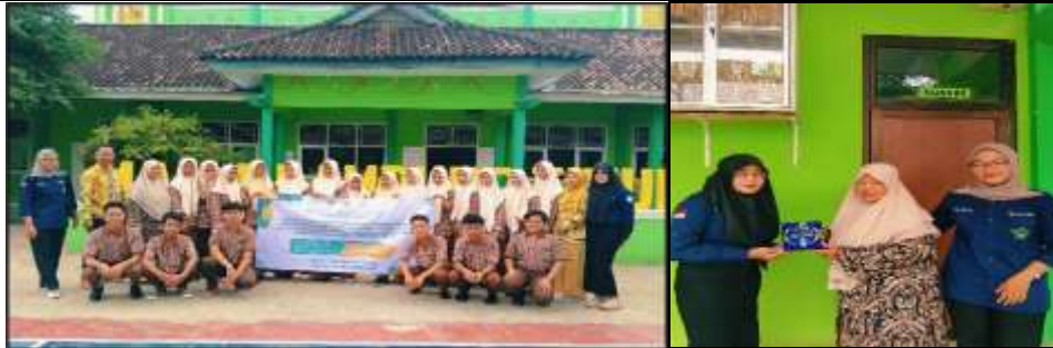
Gambar 5. Penyerahan cendramata dan sesi dokumentasi dengan siswa/i dan pihak sekolah

Berdasarkan pada pengabdian terdahulu yang dilakukan yang dilakukan oleh Rakhil Nur Praditama dan Amanita Novi Yushita menjelaskan bahwasannya pada kurikulum 2013 atau juga disebut kurikulum merdeka, waktu pembelajaran akuntansi siswa SMA/MA yang relatif singkat yaitu hanya satu periode (Praditama & Yushita, 2019). Dalam kegiatan ini bertujuan untuk meningkatkan kompetensi siswa/i MAN 1 Lampung Timur dengan memberikan pemahaman terkait akuntansi sampai dengan cara penyusunan sederhana laporan keuangan akuntansi syariah maupun konvensional.