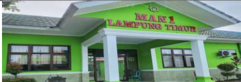
Gambar 1. Tempat Lokasi