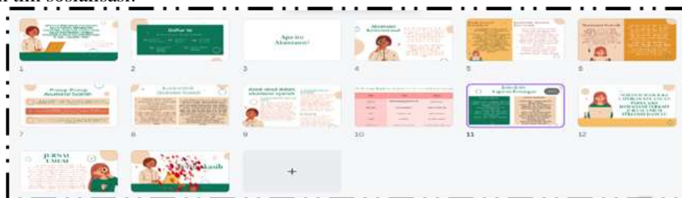
Gambar 2. Dokumentasi materi

Kegiatan sosialisasi dilaksanakan di MAN 1 Lampung Timur ini dilakukan dari tanggal 15 Agustus 2024 sampai dengan 22 Agustus 2024. Dengan beberapa kali pertemuan. Pertemuan pertama, kedua, dan ketiga dilakukannya pra kegiatan yakni dilakukan adalah melakukan kegiatan seperti survey lapangan dan koordinasi dengan pihak sekolah untuk melakukan pengabdian masyarakat dengan kegiatan sosialisasi terkait peningkatan kompetensi akuntansi siswa/i dalam penyusunan laporan keuangan syariah dan konvensional. Pada tahap ini, pihak sekolah menyambut baik berantusias dalam kegiatan sosialisasi yang diadakan oleh tim sosialisasi.