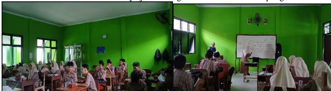
Gambar 4. Praktik dan Diskusi Terkait Peningkatan Pemahaman Penjurnalan

Setelah dirasa siswa/i sudah dapat memahami materi yang telah diberikan. Tim melanjutkan dengan memberikan pemahaman yang lebih mendalam terkait dengan perbedaan akuntansi syariah dan konvensional, dan menjelaskan jenis-jenis laporan keuangan, serta memberikan contoh-contoh berupa praktik penjurnalan laporan keuangan syariah dan konvensional kepada siswa/i MAN 1 Lampung Timur. Setelah penyampaian materi selesai dilakukan sesi diskusi dan tanya jawab dengan siswa/i MAN 1 Lampung Timur.