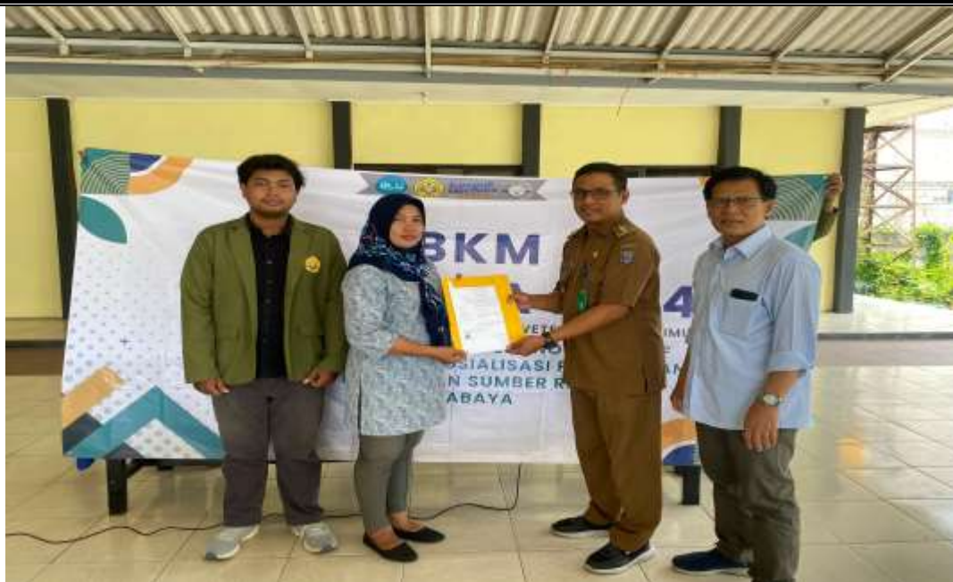
Gambar 3. Penyerahan Sertifikat Halal di Kelurahan Sumber Rejo