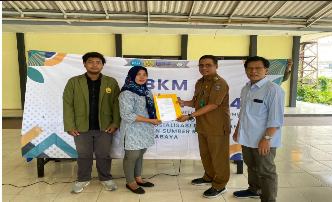
Gambar 3. Penyerahan Sertifikat Halal di Kelurahan Sumber Rejo