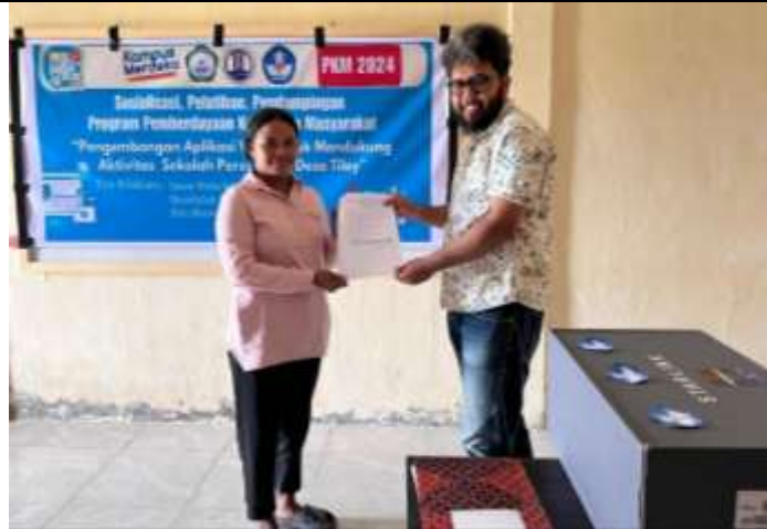
Gambar 4. Workshop Tentang Penggunaan Web