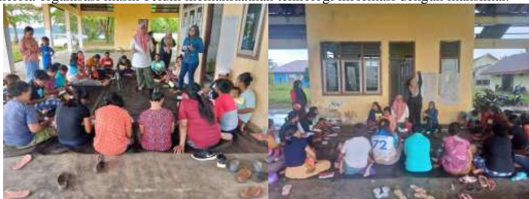
Gambar 1. Aktivitas Sekolah Perempuan Desa Tiley

Permasalahan inti yang disepakati untuk diselesaikan bersama mitra dijabarkan bersama dengan indikator ketercapaian pada tabel 1