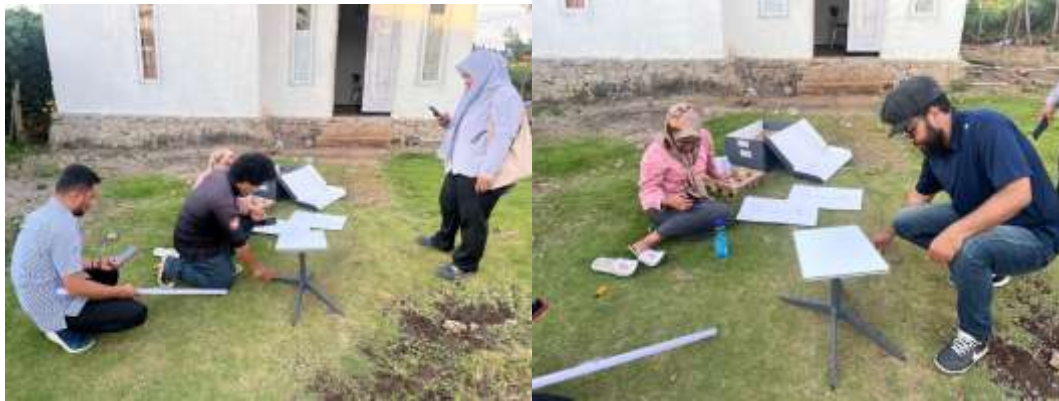
Gambar 6. Pemasangan Layanan Internet Berbasis Satelit