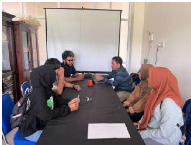
Gambar 2. FGD Bersama tim dosen, mahasiswa dan tim teknis

Kegiatan pelatihan ini dirangkaikan dengan serah terima barang (gambar 4) yang nantinya bisa mendukung aktivitas kelompok Sekolah Perempuan Desa Tiley antara lain : Cloud Hosting, Modem Starlink, Routerboard, Kabel UTP, Konektor RJ-45 Acces Point – Antena, Ethernet Starlink. Peralatan atau barang tersebut menjadi bahan dalam penerapan Teknologi.