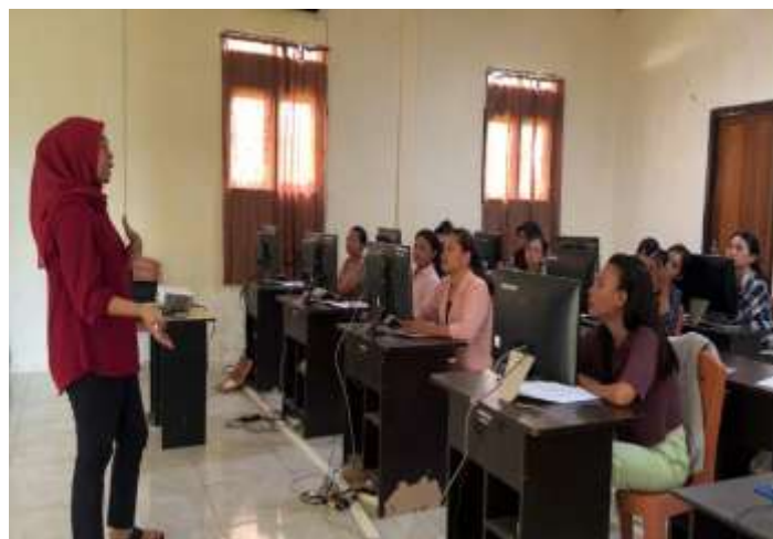
Gambar 3. Workshop Tentang Penggunaan Web