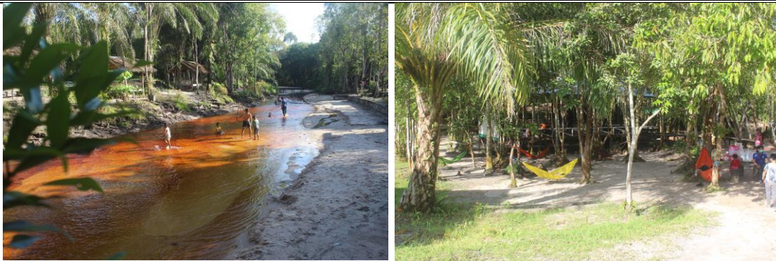
Gambar 1. Surung Danum yang merupakan salah satu objek wisata yang ada di Kecamatan Bukit Batu

Diharapkan dari kegiatan ini pengelola objek wisata kecamatan bukit batu dapat mengetahui apa itu program CHSE, mendapatkan pengetahuan baru terkait protokol program tersebut dan dapat mendaftar objek wisatanya untuk mendapatkan sertifikasi CHSE.