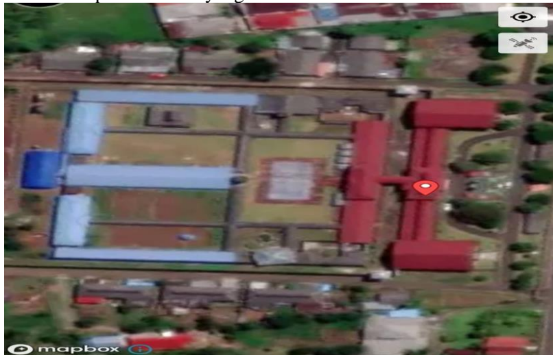
Gambar 1. Peta LPKA Kelas II Tomohon

LPKA Kelas II adalah Lembaga Pembinaan Anak Luar Biasa Kursus II Tomohon, atau disingkat LPKA Pelajaran II Tomohon, adalah sebuah lembaga atau tempat pembinaan anak-anak setelah melakukan kesalahan selama menjalani hukuman pidana. Berdasarkan Arahan Dinas Hukum dan Hak Asasi Manusia Republik Indonesia Nomor M.HH-01.IN,04.03 Tahun 2011 tentang Administrasi Dan Administrasi Data dan Dokumentasi Pada Direktorat Jenderal Pembetulan, Wilayah Kerja Dinas Hukum dan Unit Pelaksana Perancangan Hak Asasi Manusia dan Remedial yang dalam pasal 2 Ayat 1 menyatakan Data penjara terbuka dan terbuka untuk setiap klien data tetapi untuk data yang dibebaskan.