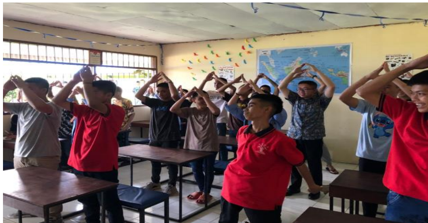
Gambar 3. Dokumentasi dengan Anak Remaja Penghuni Lapas.

Keterangan pada gambar 2 di atas adalah kegiatan pengabdian yang diawali dengan kegiatan penyuluhan atau pemberian edukasi yang di sponsori oleh tim dan mahasiswa prodi Keperawatan Sekolah Tinggi Ilmu Kesehatan Gunung Maria Tomohon.