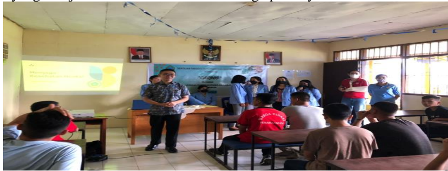
Gambar 2. Dokumentasi Kegiatan pemberian Edukasi bagi Anak Remaja Lapas.

Kegiatan ini dilaksanakan selama empat hari yaitu pada tanggal 7, 14, 21 dan 28 September tahun 2022 di LPKA Kelas II Tomohon berupa penyuluhan pada anak remaja tentang kesehatan mental. Kegiatan ini diikuti oleh 43 orang warga laki-laki untuk seluruh peserta penghuni Lapas serta Tim Pengabdian yang terdiri dari 2 orang tenaga pendidik serta 11 orang mahasiswa dan mahasiswi Program Studi D3 Keperawatan STIKES Gunung Maria Tomohon. Kegiatan diawali dengan sambutan singkat dari Kepala Lapas dan dilanjutkan dengan kegiatan penyuluhan atau pemberian edukasi pada anak remaja yang hadir tentang kesehatan mental. Dalam kegiatan ini, terjadi peningkatan pengetahuan anak remaja tentang kesehatan mental. Di akhir materi ada beberapa anak remaja penghuni Lapas yang bertanya tentang kesehatan mental. Hasil pengabdian yang dilakukan oleh Trifonia Sri Nurwela(2022) yang menyatakan bahwa stres menjadi faktor penyumbang ke-4 timbulnya penyakit pada fisik dan psikis anak remaja terlebih pada anak remaja yang menjalani masa hukuman di lembaga pemasyarakatan.