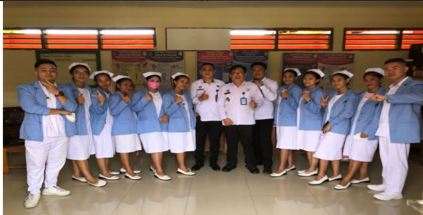
Gambar 4. Foto Bersama Tim PKM dengan Kepala Lapas dan Staf LPKA Kelas II Tomohon.