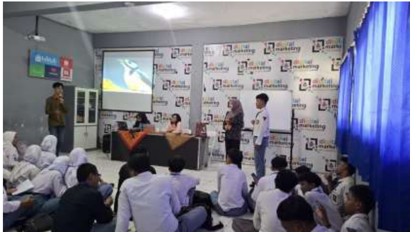
Gambar 1. Tanya Jawab Mengenai Literasi Keuangan

bagi siswa sekolah dalam mengelola keuangan pribadinya. Siswa akan dibekali dengan kemampuan dan pengetahuan mengenai literasi keuangan, sehingga dapat melakukan tindakan saving money untuk biaya hidup mereka (Masnan & Curugan, 2016). Pembekalan ini sangat berguna untuk siswa SMK yang nantinya akan masuk dalam dunia kerja untuk merubah pola kehidupannya dan gemar melakukan tindakan saving money .