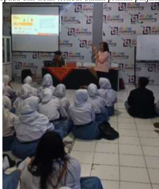
Gambar 2. Seminar Terkait Materi Literasi Keuangan

Pemerintah mendorong generasi muda untuk meleak keuangan dan pemilihan saving , investasi serta kredit ke lembaga keuangan seperti bank. Generasi muda seperti siswa-siswi SMK Swadaya Semarang mampu untuk memberikan edukasi kepada teman sebaya dan keluarga. Hal ini berdampak positif untuk lingkungan sekitar terkait edukasi literasi keuangan, sehingga masyarakat mampu untuk menghindari investasi bodong dan meminjang uang ke lintah darat. Merujuk pada laman resmi Pemerintah Provinsi Jawa Tengah bahwa terdapat 34 aplikasi pinjol (pinjaman online ) yang ilegal. Adanya pemaparan literasi keuangan agar peserta lebih waspada dan tidak terlibat dalam praktik pinjam online yang illegal .