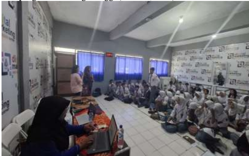
Gambar 3. Diskusi Literasi Keuangan Untuk Generasi Z

Adanya penguatan literasi kepada siswa SMK Swadaya dapat lebih bijak dalam menggunakan produk dan jasa keuangan untuk membuka bisnis ataupun saving money pada lembaga keuangan yang legal. Siswa dapat melakukan pengelolaan anggaran secara lebih kompleks dengan tujuan jangka panjang. Siswa dapat mengetahui investasi yang terbaik bagi pelajar, sehingga dapat memikirkan perencanaan keuangan untuk masa depan. Literasi keuangan bersifat sufficient literate akan membuat karakter yang baik bagi siswa dalam membuat keputusan mengelola keuangannya, selain itu juga dapat mengurangi risiko utang yang tidak terkontrol atau investasi yang berisiko sangat tinggi (Miswan, 2019).