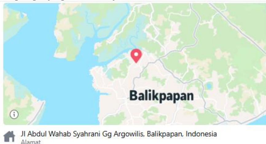
Gambar 1. Foto Lokasi Panti Aisyiyah

Panti Asuhan ‘Aisyiyah bertempat di Jl Abdul Wahab Syahrani Gg Argowilis, Balikpapan, Indonesiasebagai tempat perlindungan dan pendidikan anak-anak, menghadapi tantangan dalam memberikan pemahaman yang cukup kepada para santri mengenai bullying dan kekerasan seksual. Hal ini didukung oleh temuan dari survei awal yang menunjukkan bahwa mayoritas santri belum sepenuhnya memahami konsep bullying dan cara menghadapinya. Minimnya sumber daya dan kurangnya edukasi menjadi kendala utama dalam menciptakan lingkungan yang aman dan suportif.