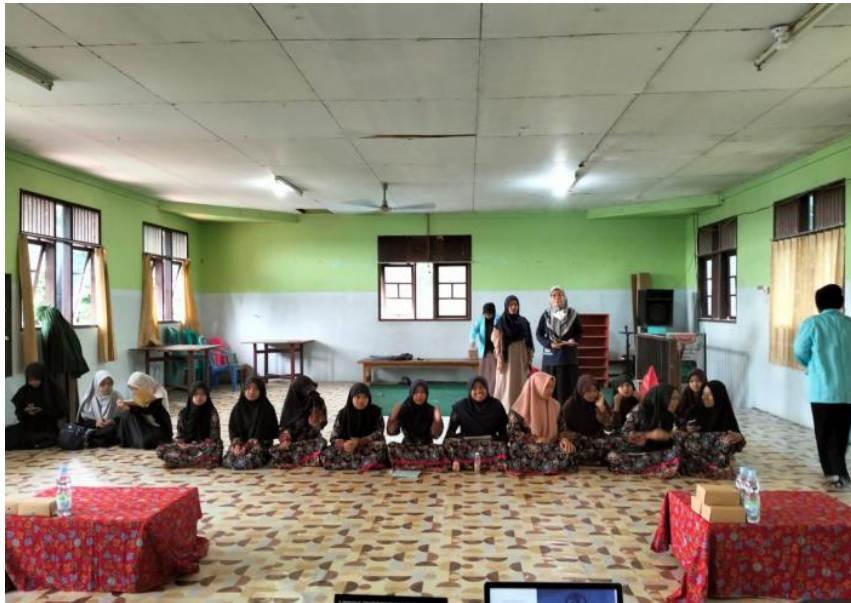
Gambar 4. Peserta

untuk pendidikan seksual di sekolah. Dalam penelitian ini, pendekatan edukasi non-formal terbukti efektif untuk peserta di lingkungan panti asuhan, di mana akses terhadap materi pendidikan formal lebih terbatas. Berbeda dengan penelitian Khaliza et al. (2021), yang berfokus pada efek bullying dan kekerasan seksual terhadap kesehatan mental siswa sekolah formal, kegiatan ini dirancang untuk kelompok rentan seperti santri panti asuhan. Hal ini menambah kontribusi baru pada literatur tentang pendekatan edukasi di lingkungan non-formal. Pendekatan ini sejalan dengan penelitian Jatmiko et al. (2024), yang menekankan pentingnya pendekatan berbasis komunitas. Namun, penelitian ini memodifikasi metode tersebut dengan mengintegrasikan sesi diskusi yang memberdayakan peserta untuk menjadi agen perubahan di lingkungan mereka.