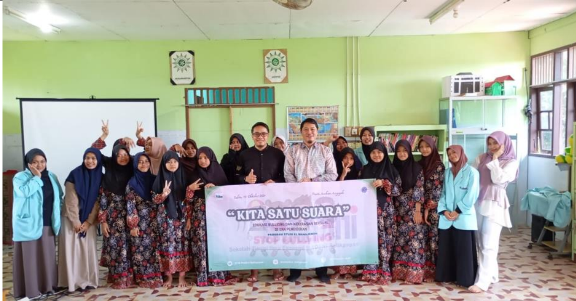
Gambar 5. Foto Bersama Peserta

Hasil kegiatan ini menunjukkan pentingnya program edukasi berbasis komunitas untuk menciptakan lingkungan pendidikan yang aman. Peserta yang awalnya kurang memahami isu bullying dan kekerasan seksual kini memiliki pengetahuan yang lebih baik dan komitmen untuk menerapkan pembelajaran tersebut dalam kehidupan sehari-hari. Implikasi jangka panjang dari kegiatan ini diharapkan tidak hanya dirasakan oleh para peserta, tetapi juga oleh lingkungan mereka, sehingga tercipta kesadaran kolektif yang lebih luas.