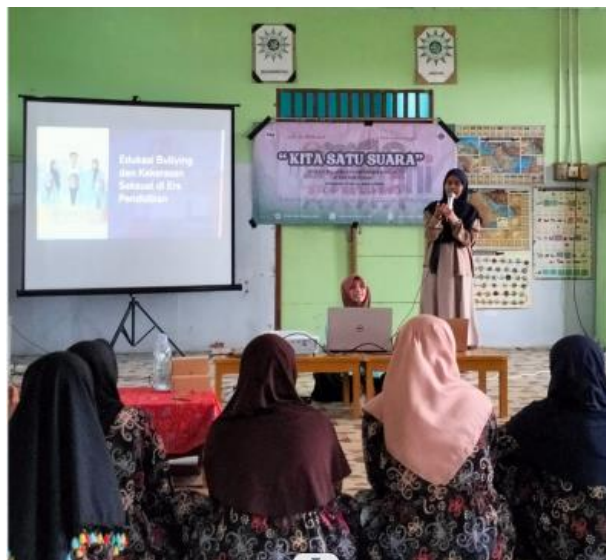
Gambar 3. Sesi Materi

Pelaksanaan kegiatan edukasi tentang bullying dan kekerasan seksual di Panti Asuhan ‘Aisyiyah berlangsung dengan baik dan sesuai dengan rencana yang telah ditetapkan. Kegiatan ini diikuti oleh 16 santri putri berusia 12 hingga 17 tahun. Peserta hadir secara penuh dan menunjukkan tingkat partisipasi yang tinggi selama kegiatan berlangsung. Mereka terlibat aktif dalam seminar dan diskusi interaktif, yang menjadi inti dari metode kegiatan ini.