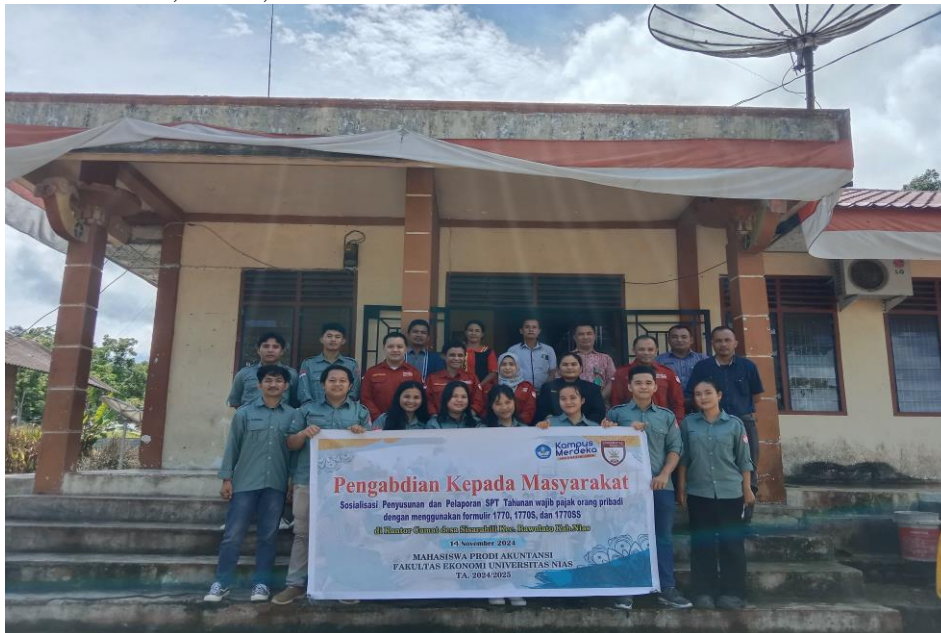
Gambar 1. Foto Bersama di Lingkungan Kantor Camat Bawolato, Kabupaten Nias

sebagai bukti otentikasi pengguna layanan pajak. (Martha, 2020). Untuk membedakan formulir ini yaitu berdasarkan dengan besaran serta sumber penghasilan pegawai serta status dari pegawai tersebut. Dalam hal ini, formulir 1770 diperuntukkan untuk WPOP yang statusnya sebagai pekerja, pemilik usaha ataupun pekerja yang berkeahlian tertentu serta tidak terikat kontrak kerja. Untuk formulir 1770 S diperuntukkan untuk WPOP dengan penghasilan 0 sampai 60 Juta setiap tahun serta ditujukan juga kepada orang yang bekerja dalam dua perusahaan dengan kurun waktu tertentu. Terakhir, formulir 1770 SS yang diperuntukkan untuk WPOP dengan penghasilan kurang dari 60 Juta per tahun dan yang bekerja dalam satu perusahaan minimal setahun. (Mayasari, 2024). Adapun permasalahan yang dirumuskan dalam kegiatan ini adalah bagaimana meningkatkan pengetahuan dan kemampuan para pegawai kantor Camat Desa Sisarahili, Kecamatan Bawolato, Kabupaten Nias dalam menyusun dan melaporkan SPT Tahunan Orang Pribadi dengan menggunakan formulir 1770, 1770 S, dan 1770 SS melalui situs resmi DJP Online?