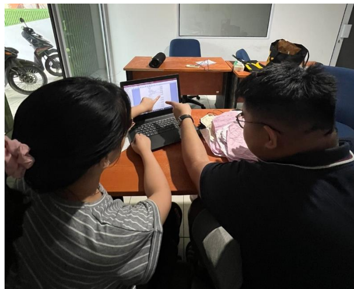
Gambar 12. Dokumentasi Kegiatan, Sumber: Penulis (2022)