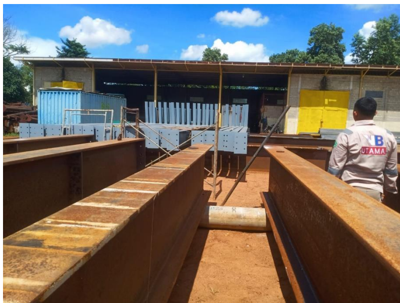
Gambar 3. Warehouse PT Vista Bangun Utama