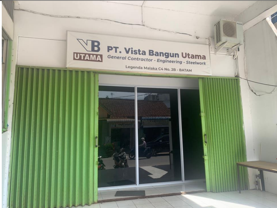
Gambar 2. Kantor Operasional PT Vista Bangun Utama