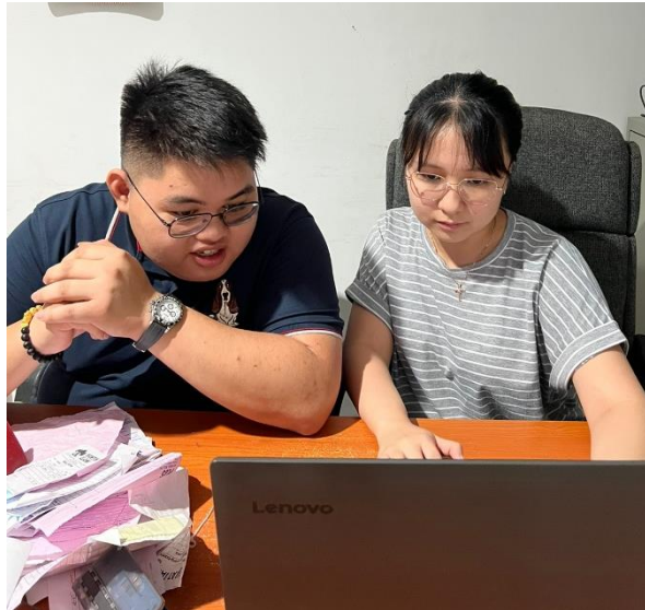
Gambar 11. Dokumentasi Kegiatan