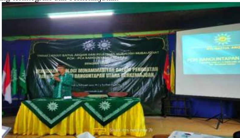
Gambar 2. Kegiatan Peneguhan Idiologi Muhammadiyah

2. Kegiatan pengabdian masyarakat ini meliputi: Peneguhan idiologi Muhammadiyah dan Strategi Dakwah. Sasaran kajian ini adalah pengurus Muhammadiyah dan muballigh PCM Banguntapan Utara dengan tujuan membangkitkan ghiroh berdakwah, dan mempersamakan pandangan keagamaan dalam perspektif Muhammadiyah, diantaranya Islam Washatiah (moderat) dan Islam rahmatan lil alamin dalam pandangan Muhammadiyah, serta peneguhan amanah Mukhtar Muhammadiyah tahun 2022 ke tingkat Cabang dan Ranting Muhammadiyah tentang risalah Islam berkemajuan dan menyusun manajemen dakwah Muhammadiyah yang terintegrasi dan berkelanjutan.