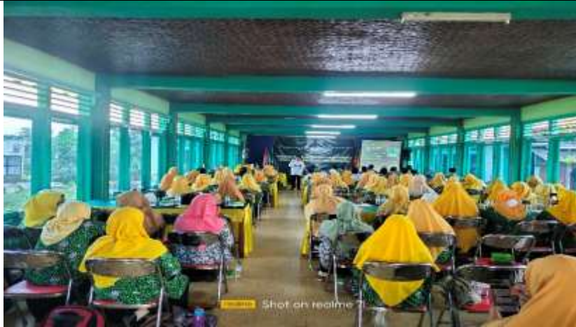
Gambar 3. Pelatihan Metode Dakwah

Adapun manfaat selama pengabdian masyarakat ini berlangsung diantaranya: Kegiatan pengabdian ini telah memberikan manfaat secara luas bagi jamaah dan warga muhammadiyah, terutama para da'i Muhammadiyah PCM Banguntapan utara, sehingga memiliki wawasan yang luas tentang Keislaman dan memiliki perspektif Muhammadiyah yang kokoh, sesuai dengan manhaj Muhammadiyah. Kemudian kegiatan pengabdian ini telah mampu meningkatkan kemampuan dan skill para da'i PCM Banguntapan utara dalam berdakwah di lingkungan Kecamatan Bannuntapan Selatan, diantaranya dengan dakwah kultural dan memiliki pandangan yang berkemajuan. Dengan adanya kegiatan ini telah mampu meningkatkan konsolidasi kekuatan gerakan jama'ah Muhammadiyah akar rumput se-PCM Banguntapan utara, dengan manajemen dakwah yang rapi dan terprogram. Pengabdian ini melengkapi pengabdian sebelumnya seperti Handayani, P., & Faizah, I. (2020); Hamdanny, (2021); Lubis, dkk (2023); Fathurrahman (2024); Ramadhan & Hermansyah, (2024), yang mencoba merumuskan model dakwah Muhammadiyah dengan pola sinergisitas lintas masjid dan solid bersama Aisyiyah.