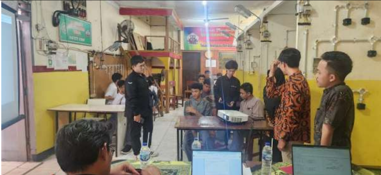
Gambar 6. Diskusi dengan siswa yang menyampaikan pertanyaan

Setelah sesi diskusi, peserta diberikan kesempatan untuk memberikan feedback melalui Google Form yang telah disediakan. Feedback ini bertujuan untuk mengevaluasi pemahaman peserta terhadap materi yang telah disampaikan serta mengetahui sejauh mana teknologi ini dapat diterima di lingkungan sekolah. Peserta mengisi feedback pada google form melalui QR Code.