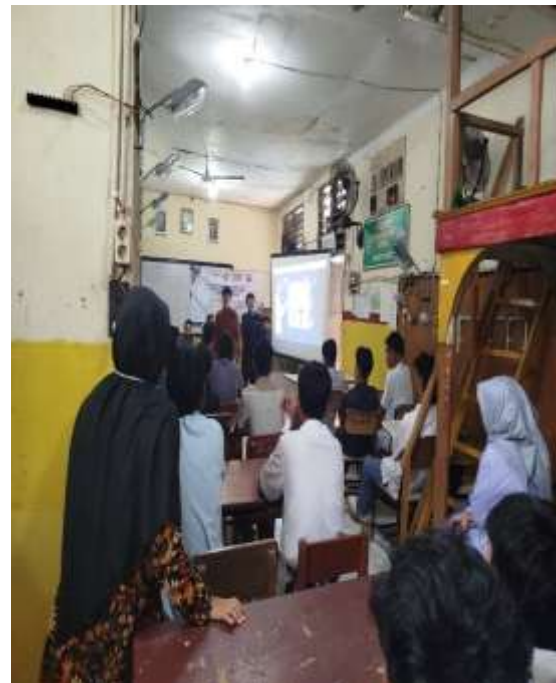
Gambar 7. Pengisian Feedback oleh siswa

Hasil implementasi Smart Bell berbasis IoT menunjukkan peningkatan signifikan dibandingkan dengan sistem bel manual yang sebelumnya digunakan di SMK S Jakarta 1. Setelah pemasangan, uji coba menunjukkan bahwa bel dapat dikendalikan dengan stabil melalui aplikasi Blynk , dan suara yang dihasilkan cukup jelas untuk didengar di seluruh area sekolah. Selain itu, kepala sekolah dan tenaga pendidik menerima hibah perangkat Smart Bell dan diberikan pelatihan untuk pengoperasiannya. Berdasarkan diagram dari google form yang telah diisi oleh siswa, para siswa memberikan feedback yang baik, dari mulai materi yang disampaikan mudah dipahami, penyampaian yang jelas, penyajiannya tidak membosankan dan interaktif, materi yang diberikan sesuai dengan kebutuhan dari sekolah dan menambah pengetahuan siswa dan secara