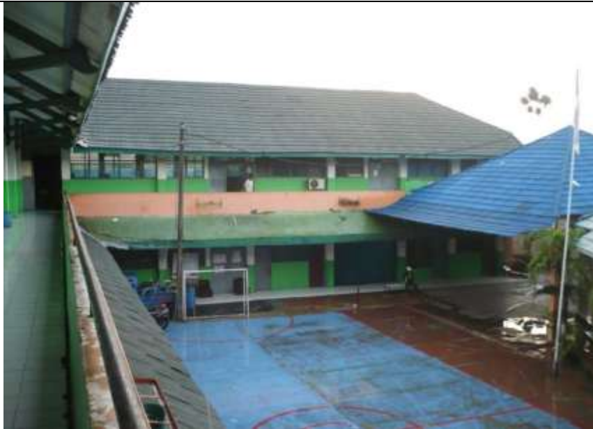
Gambar 1. Lokasi Sekolah Menengah Kejuruan Jakarta 1