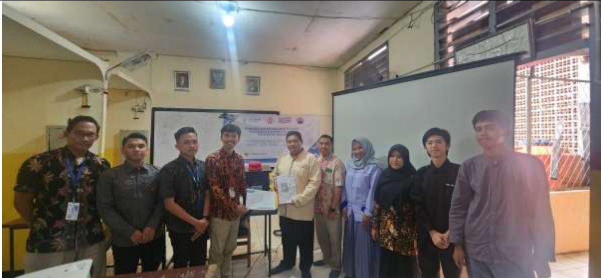
Gambar 9. Penyerahan perangkat smart bell kepada pihak sekolah

Hasil implementasi Smart Bell berbasis IoT menunjukkan, petugas sekolah merasa lebih terbantu karena tidak lagi perlu membunyikan bel secara manual. Dari segi teknis, sistem bekerja dengan baik meskipun terdapat beberapa tantangan awal, seperti konektivitas jaringan yang kadang tidak stabil. Namun, dengan penyesuaian terhadap sistem jaringan sekolah, masalah ini dapat diminimalisir. Selain itu, pihak sekolah memberikan umpan balik positif terkait kemudahan penggunaan aplikasi pengontrol bel. Tantangan lain yang dihadapi adalah adaptasi pengguna terhadap teknologi baru. Beberapa staf sekolah yang belum familiar dengan teknologi IoT awalnya mengalami kesulitan dalam mengoperasikan sistem. Namun, melalui pelatihan yang diberikan, mereka dapat memahami cara kerja Smart Bell dan merasa lebih percaya diri dalam menggunakannya.