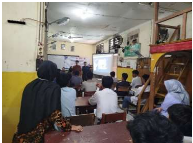
Gambar 3. Sambutan Ketua Pelaksana PKM

Setelah sambutan, mahasiswa yang tergabung dalam tim pengabdian memberikan penjelasan secara rinci mengenai konsep dasar Internet of Things (IoT) , cara kerja smart bell , bagaimana pemrograman nya