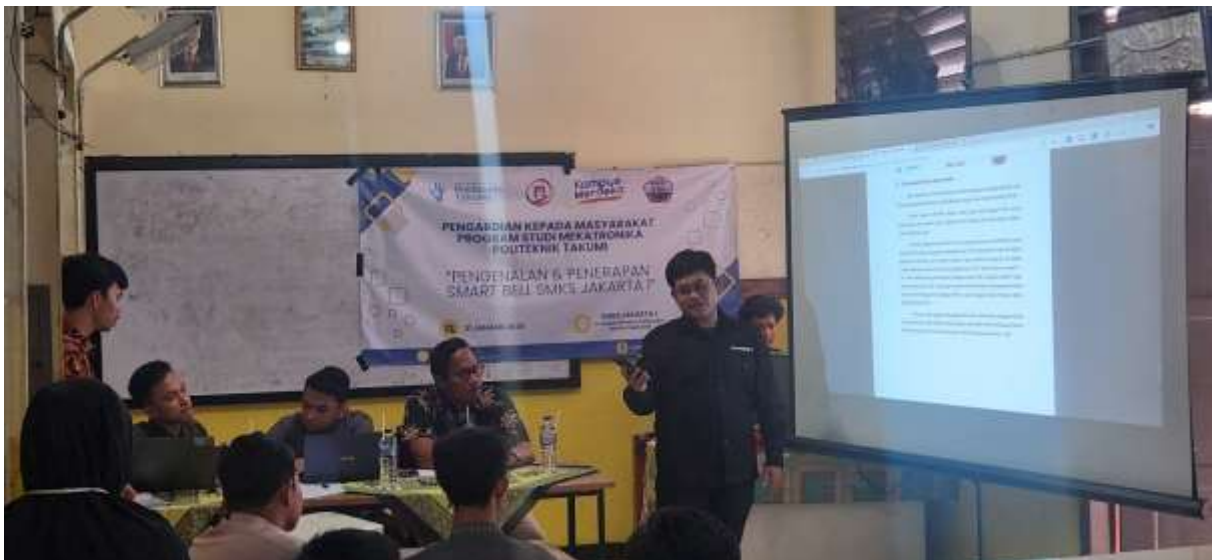
Gambar 5. Pemaparan dari Mahasiswa Mekatronika

Setelah demonstrasi, sesi tanya jawab dan diskusi dilakukan untuk memberikan pemahaman lebih mendalam kepada peserta. Dalam sesi ini, peserta diberikan kesempatan untuk menyampaikan pertanyaan dan berdiskusi mengenai smart bell yang telah di jelaskan begitu pula tentang tantangan yang mungkin dihadapi dalam implementasi sistem ini di lingkungan sekolah mereka.