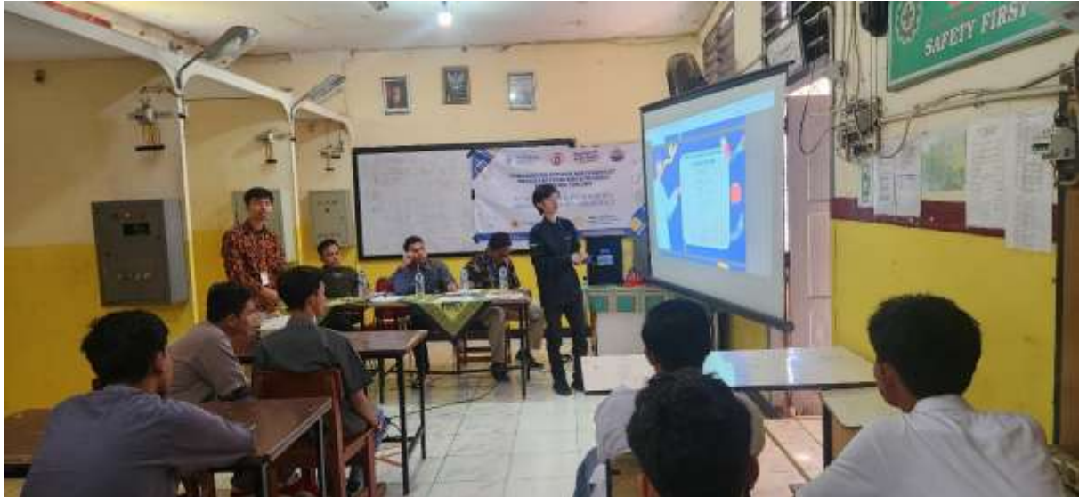
Gambar 4. Pemaparan dari Mahasiswa Mekatronika

menggunakan software arduino IDE, serta manfaat teknologi ini dalam dunia pendidikan, serta bagaimana sistem Smart Bell dapat meningkatkan efisiensi operasional sekolah. Sesi presentasi dilanjutkan dengan demonstrasi langsung mengenai cara kerja Smart Bell , termasuk bagaimana sistem ini dikendalikan melalui aplikasi berbasis smartphone . Para peserta diberikan kesempatan untuk mencoba mengoperasikan perangkat secara langsung, sehingga mereka dapat memahami cara penggunaan serta pemeliharaan dasar perangkat tersebut.