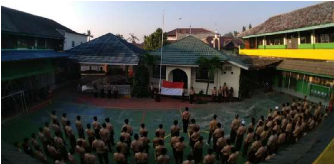
Gambar 2. Suasana Sekolah Menengah Kejuruan Jakarta 1