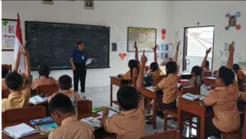
Gambar 1. Penerapan permainan kartu huruf pada siswa