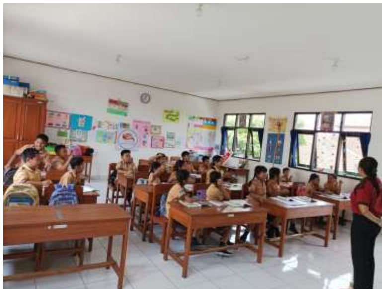
Gambar 2. Antusias siswa belajar dengan permainan kartu huruf