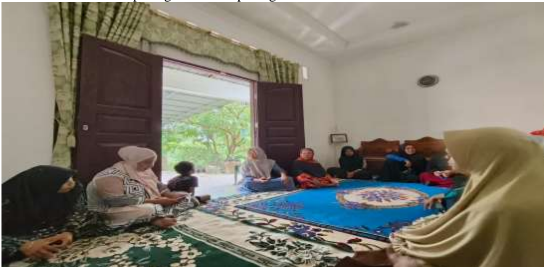
Gambar 3. Suasana saat kegiatan pengabdian berlangsung

Ketiga, setelah penyampaian materi selesai. Masuk pada sesi tanya jawab, pada sesi ini ibu-ibu majlis taklim ihram riau terlihat sangat antusias dalam bertanya. Terlihat beberapa diantaranya mengangkat tangannya. Pemateri kemudian kembali menjelaskan dan menjawab pertanyaan dari para peserta pengabdian. Setelah sesi tanya jawab selesai, maka kegiatan pengabdian ini ditutup dengan pengisian kuesioner untuk melihat kepuasan para peserta pengabdian selama mengikuti kegiatan. Dan didapatkan kesimpulan bahwa keseluruhan dari ibu-ibu yang tergabung dalam majlis taklim ihram riau merasa puas dengan materi yang disampaikan. Kemudian tidak lupa kegiatan ditutup dengan sesi foto bersama.