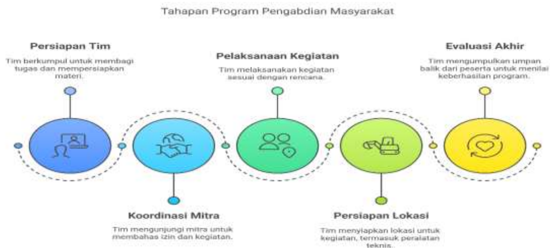
Gambar 2. Tahapan Program pengabdian Masyarakat

Ketiga, Evaluasi. Evaluasi disini maksudnya kegiatan terakhir dari serangkaian kegiatan pengabdian yang telah dilakukan. Adapun bentuk aktivitas yang dilakukan pada tahapan ini, diantaranya meminta feedback dari Mitra yakni jemaah Majelis Taklim Ihram Riau untuk mengetahui apakah kegiatan pengabdian ini sesuai dengan kebutuhan dan memberikan perubahan kognitif bagi mereka atau tidak. Selain itu evaluasi disini juga ditujukan untuk mengetahui respon dari para peserta terhadap kegiatan pengabdian yang telah berlangsung. Tim sudah menyiapkan sejumlah pertanyaan pada sebuah kuesioner untuk selanjutnya dibagikan kepada para peserta. Hal ini dilakukan agar tim dapat melihat dan mengukur tingkat kepuasan mitra terhadap kegiatan pengabdian yang telah dilakukan. Adapun metode yang dilakukan dalam kegiatan pengabdian ini dirangkum dalam bentuk bagan di bawah ini :