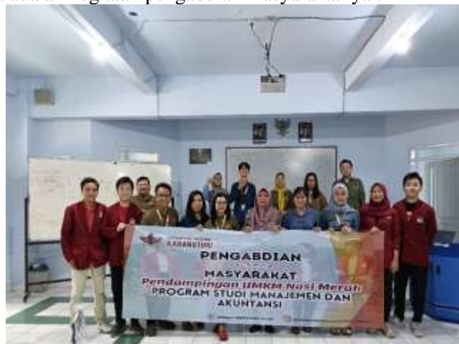
Gambar 1. Lokasi Pengabdian Masyarakat UMKM Nasi Merah