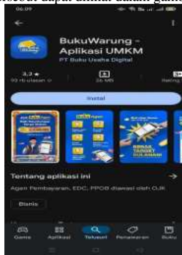
Gambar 2. Aplikasi Buku Warung

Adapun aplikasi Buku Warung tersebut dapat dilihat dalam gambar dibawah ini: