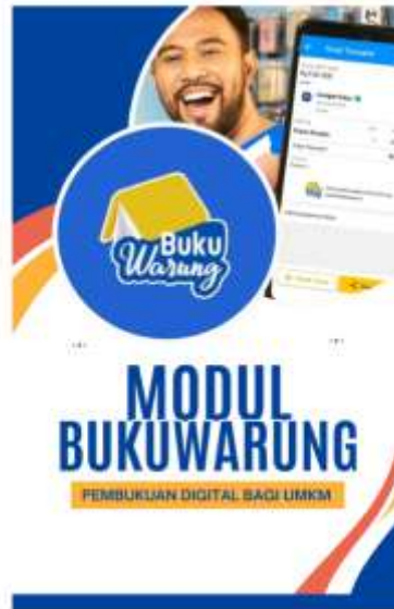
Gambar 3. Aplikasi Modul Buku Warung

Adapun kebermanfaatannya dapat dilihat dari kemampuan pemilik bisnis terkait dalam menginput penjualannya dan mengekstrak laporan yang dapat dilihat dari gambar berikut ini :