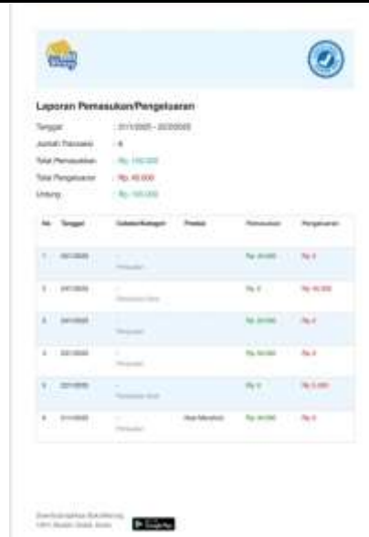
Gambar 5. Laporan Keuangan di Aplikasi Buku WarungG