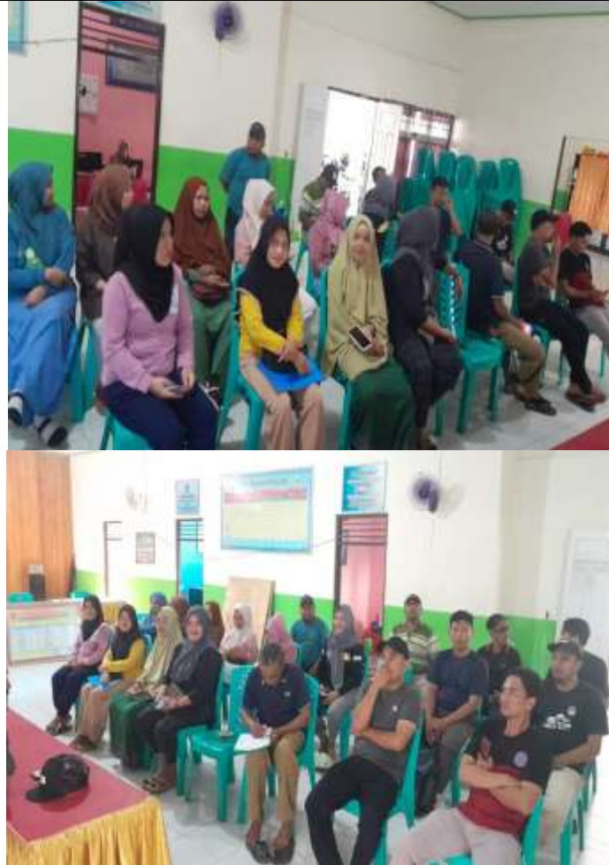
Gambar 2. Kegiatan Pelatihan Keuangan

Dalam penelitian ini, kami mengukur dampak dari pelatihan keuangan berbasis digital bagi pelaku UMKM di Kecamatan Limboto. Hasil dari pelatihan ini menunjukkan adanya peningkatan signifikan dalam pemahaman dan keterampilan peserta dalam mengelola keuangan usaha mereka, khususnya melalui pemisahan keuangan pribadi dan usaha serta penggunaan aplikasi keuangan digital seperti BukuKas dan Catatan Keuangan Harian. Peningkatan ini tidak hanya terbatas pada pengetahuan, tetapi juga tercermin dalam perubahan perilaku peserta yang mulai lebih disiplin dalam pencatatan transaksi dan perencanaan keuangan.