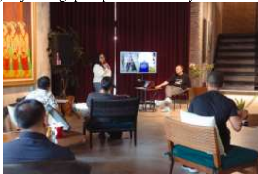
Gambar 1. Penyampaian Materi Oleh Penulis

Dalam tahapan terakhir ini, penulis melakukan survey kembali untuk dapat mengetahui seberapa besar perubahan paradigma yang terjadi bagi para peserta lokakarya.