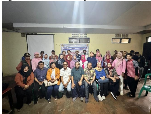
Gambar 3. Kegiatan Pengabdian Masyarakat Departemen Hukum Ekonomi Universitas Padjadjaran di Aula Desa Bumiwangi, Kecamatan Ciparay

jalur pengadilan, sehingga dapat mengantisipasi dan menangani potensi konflik secara efektif tanpa mengganggu kelangsungan usaha. Menurut beberapa penulis, BUMDes idealnya memiliki Standar Operasional Prosedur (SOP) yang mengatur tata kelola kontrak bisnis yang dijalankan, mulai dari proses negosiasi, penandatanganan, pelaksanaan, hingga evaluasi kontrak. SOP ini berfungsi sebagai pedoman internal yang memastikan konsistensi, transparansi, dan akuntabilitas dalam pengelolaan kontrak, sekaligus meningkatkan profesionalisme dan kepercayaan mitra bisnis terhadap BUMDes. Dengan demikian, pengelolaan aspek hukum kontrak yang baik menjadi salah satu kunci keberhasilan BUMDes dalam menjalankan usahanya secara legal, efisien, dan berkelanjutan.