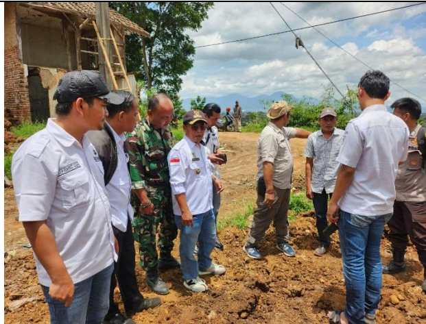
Gambar 1. Peletakan Batu Pertama BUMDes budi daya ikan air tawar di Desa Bumiwangi