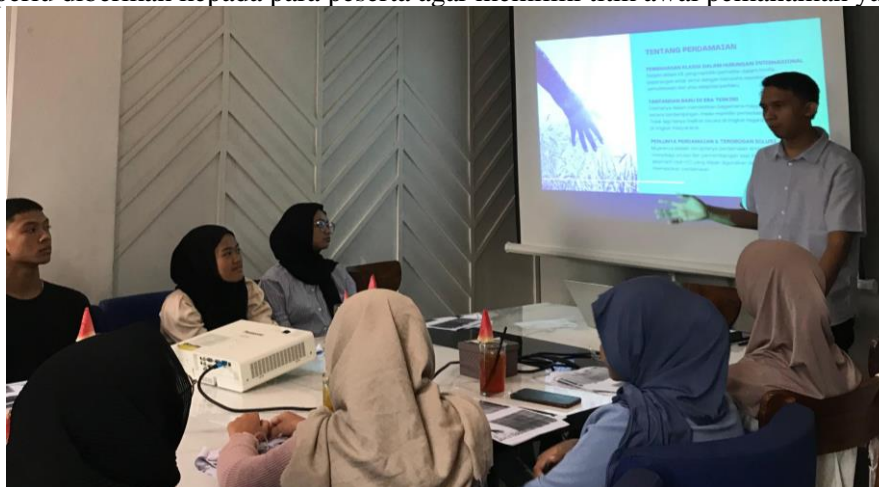
Gambar 2. Paparan Materi Toleransi dalam Kelas Keberagaman

Paparan Materi Toleransi yang disampaikan oleh tim pengabdian masyarakat memuat beberapa topik utama, antara lain (1) tentang perdamaian, (2) formulasi dan inisiasi agenda, (3) cerita dari ‘kelas keberagaman, (4) toleransi – keberagaman, (5) kamu dan kertas kerja, dan (6) penutup. Pada topik pertama, tim pengabdian masyarakat menyampaikan atas perkembangan terkini tentang problem serta tantangan yang dihadapi tentang masalah perdamaian di level internasional, nasional, sampai dengan lokal. Topik awal ini merupakan materi pengantar yang perlu diberikan kepada para peserta agar memiliki titik awal pemahaman yang sama.