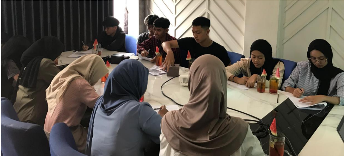
Gambar 3. Penulisan dan Pengisian Kertas Kerja

Kegiatan ini memiliki tujuan utama untuk membantu peserta melakukan penggalian, mengingat kembali, serta menuliskan kembali pengalaman mereka atas keberagaman yang pernah dialaminya secara langsung maupun tidak langsung. Lewat penulisan pengalaman tersebut, peserta diajak untuk kembali merasakan bagaimana keberagaman sesungguhnya telah ada di sekitar mereka dalam masa hidupnya. Menulis menjadi aktivitas yang bisa mengasah kecerdasan serta ruang yang positif untuk menyampaikan gagasan (Hartono et al., 2024). Fasilitator hanya memberikan petunjuk-petunjuk besar bagaimana kertas kerja yang ada di hadapan peserta dapat diisi secara personal.