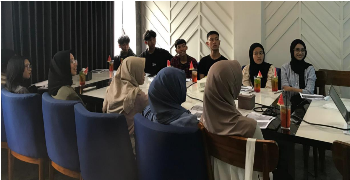
Gambar 2. Diskusi bersama Peserta Kelas Keberagaman

Diskusi bersama Peserta merupakan rangkaian penutup yang menjadi bagian penting untuk mendapatkan respon balik dari peserta. Hal ini diperlukan untuk mendapatkan pemahaman toleransi dengan membuka ruang dialog yang inklusif, terbuka, dan melibatkan peserta secara aktif. Pada tahapan ini dilakukan elaborasi nilai-nilai toleransi utamanya dalam kehidupan sehari-hari pada kehidupan bermasyarakat, berbangsa, dan bernegara. Perkembangan era digital, persebaran informasi yang cepat dapat membangun hoaks dan provokasi yang bisa menjerat siapa saja sehingga mengikis toleransi pemuda (Marnia Hazwani, 2022). Tim Pengabdian Masyarakat kemudian berperan sebagai fasilitator untuk mendapatkan masukan, pertanyaan, serta konfirmasi pada hal-hal yang menjadi keresahan dari para peserta tentang toleransi. Pada sesi diskusi ini peserta diberikan ruang serta waktu untuk mengutarakan pendapat serta gagasannya terkait toleransi. Sesi ini diperlukan untuk mendapatkan edukasi yang utuh serta dialogis sehingga tidak bersifat satu arah, melainkan dua arah atau secara resiprokal.