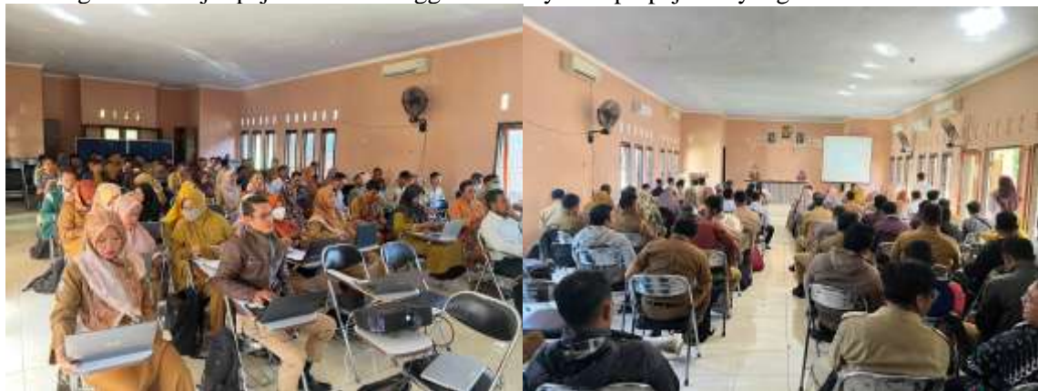
Gambar 7. Pendampingan Aktivasi Coretax oleh Relawan Pajak dengan Pegawai KPP Mataram Timur pada wilayah kerja KPP

Relawan Pajak di lingkungan Kantor Pelayanan Pajak (KPP) Pratama Mataram Timur tidak hanya memberikan asistensi dalam pelaporan SPT dan aktivasi akun Coretax di kantor, tetapi juga berperan aktif dalam kegiatan sosialisasi serta pendampingan aktivasi Coretax secara lebih luas di wilayah kerja KPP Mataram Timur. Kegiatan ini dilaksanakan melalui kerja sama langsung antara relawan pajak dan pegawai KPP, dengan mengunjungi berbagai instansi, lembaga, serta titik-titik keramaian publik yang berada dalam cakupan administratif KPP Mataram Timur. Tujuan utama dari kegiatan ini adalah menjangkau Wajib Pajak Orang Pribadi yang mungkin tidak memiliki kesempatan datang langsung ke kantor pajak, sekaligus meningkatkan literasi dan kesiapan masyarakat dalam menghadapi transisi menuju sistem Coretax Administration System yang akan diberlakukan penuh mulai tahun pajak 2026.