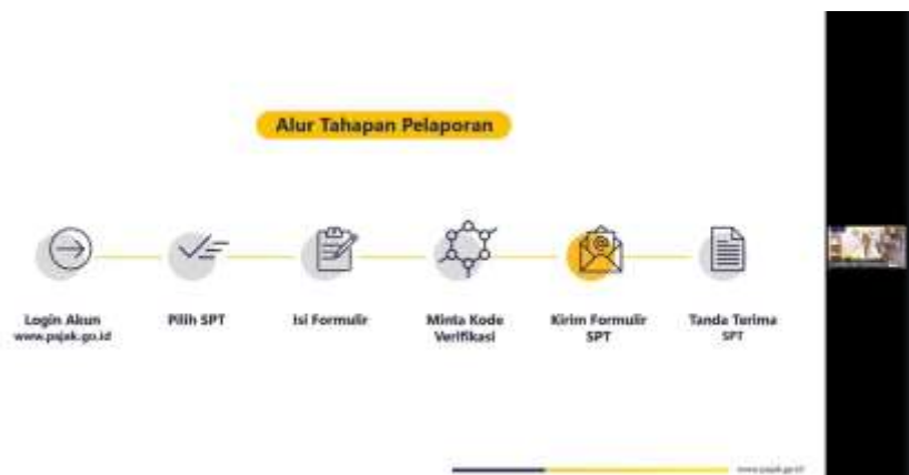
Gambar 2. Pelatihan online Relawan Pajak Oleh DJP

Sebelum memulai tugas asistensi kepada Wajib Pajak, para Relawan Pajak terlebih dahulu mengikuti kegiatan pelatihan dan pembekalan yang diselenggarakan oleh pihak Direktorat Jenderal Pajak (DJP). Kegiatan ini dilaksanakan pada tanggal 17 Januari 2025 bertempat di Aula KPP Mataram Timur dan diselenggarakan secara hybrid, yaitu melalui pertemuan offline dan online, guna menjangkau seluruh peserta dengan lebih efektif. Dalam tahapan pelatihan ini, para relawan mendapatkan pembekalan mengenai tata cara pelaporan SPT Tahunan Orang Pribadi, termasuk penggunaan sistem e-Filing melalui laman DJP Online di https://djponline.pajak.go.id . Selain itu, relawan juga diberikan pemahaman tentang proses aktivasi Coretax, yang merupakan sistem terbaru dalam administrasi perpajakan. Materi lainnya mencakup Kode Etik Relawan Pajak, yang menjadi pedoman perilaku selama memberikan asistensi, serta pemahaman mengenai kewajiban perpajakan dan jenis-jenis Pajak Penghasilan (PPh). Pelatihan ini menjadi langkah awal yang penting untuk memastikan para Relawan Pajak dapat menjalankan tugas dengan kompeten, profesional, dan sesuai dengan ketentuan yang berlaku.