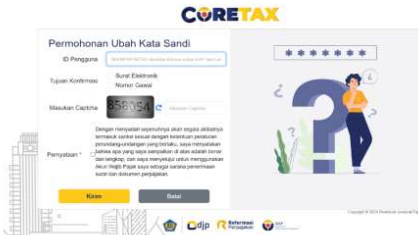
Gambar 6. Tampilan riset pasword pada aplikasi coretax