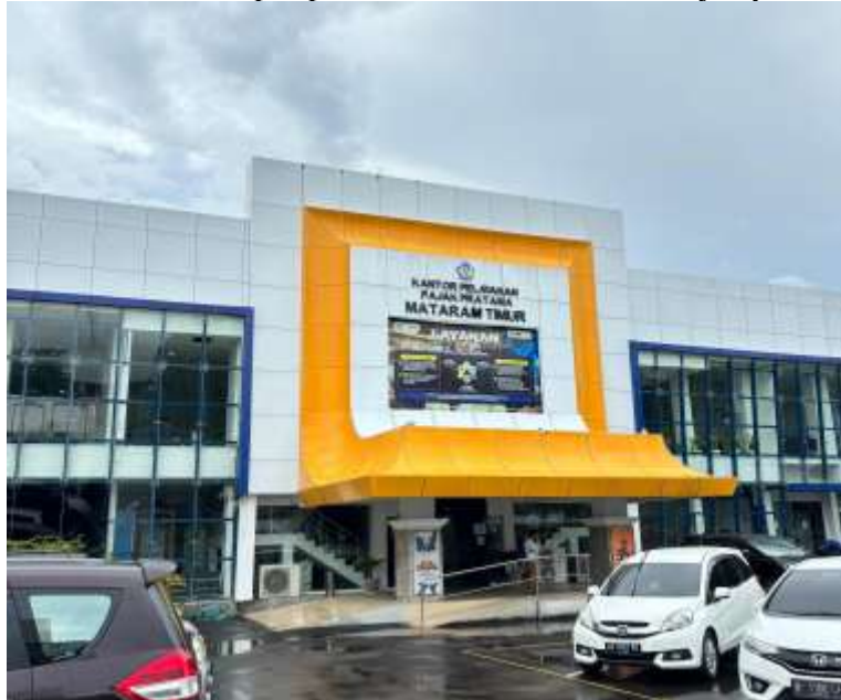
Gambar 1. Lokasi Pengabdian Masyarakat di KPP Mataram Timur

Salah satu upaya strategis yang dilakukan untuk menjawab kebutuhan tersebut adalah dengan melibatkan mahasiswa relawan pajak. Para relawan ini telah mendapatkan pelatihan mengenai prosedur perpajakan, termasuk pengisian SPT melalui e-Filing, sehingga mampu memberikan asistensi kepada wajib pajak secara efektif. Tidak hanya itu, dalam beberapa kasus di lapangan, masih banyak wajib pajak yang belum melakukan aktivasi akun Coretax, yang merupakan sistem baru Direktorat Jenderal Pajak untuk mendukung pelaporan pajak di tahun-tahun berikutnya. Kurangnya sosialisasi dan pemahaman mengenai pentingnya aktivasi akun ini dapat menjadi penghambat kepatuhan perpajakan di masa depan. Oleh karena itu, relawan pajak juga berperan penting dalam memberikan pemahaman mengenai aktivasi akun Coretax, agar wajib pajak dapat lebih siap dan mandiri dalam melakukan pelaporan untuk tahun-tahun selanjutnya.