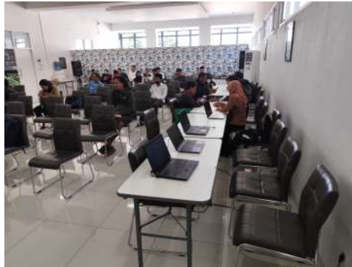
Gambar 3. Suasana proses asistensi oleh relawan pajak

Layanan asistensi ini dilaksanakan secara penuh tanpa sistem giliran (non-shift), setiap hari kerja dari Senin hingga Jumat, pukul 08.00 hingga 16.00 WITA, dengan menyesuaikan jumlah dan kebutuhan wajib pajak yang hadir setiap harinya. Setelah berhasil melaporkan SPT Tahunan, wajib pajak akan menerima Bukti Penerimaan Elektronik (BPE) yang secara otomatis dikirimkan ke alamat email yang terdaftar.