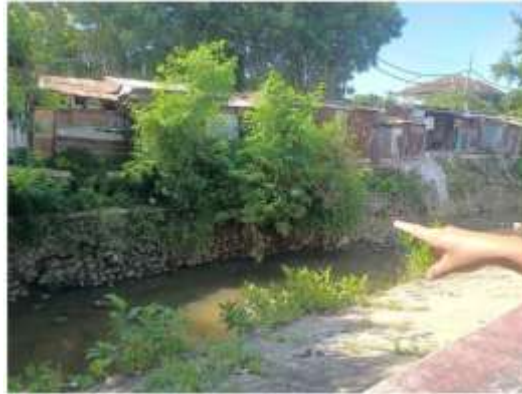
Gambar 2. Salah Satu Kerusakan Pada Talut Sungai di Kelurahan Lampe Lor

Dari wawancara yang dilakukan oleh Tim PkM Universitas Semarang (USM) dengan pihak Kelurahan Lamper Lor pada tanggal 16 April 2025 yang bertempat di Kelurahan Lamper Lor, dapat diketahui bahwa masalah yang timbul adalah kurang maksimalnya penggunaan anggaran untuk pemeliharaan saluran air di tiap Rukun Tetangga (RT). Pihak Kelurahan Lamper Lor menyatakan selama ini sudah ada metoda untuk mencari prioritas pemeliharaan saluran air dengan sistim pemberian skor namun bukan AHP, tujuan dari program Pengabdian Kepada Masyarakat USM ini adalah memberikan metode alternatif untuk pemeringkatan skala prioritas pada program pemeliharaan atau rehabilitasi jaringan saluran drainase di wilayah Kelurahan Lamper Lor, Semarang.