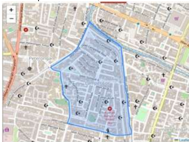
Gambar 1. Peta Kelurahan Lamper Lor

Berikut adalah peta Kelurahan Lamper Lor: