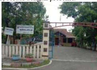
Gambar 3. Kantor Kelurahan Lamper Lor

Pelaksanaan pelatihan diadakan pada tanggal 18 Mei 2025 bertempat di Aula Kelurahan Lamper Lor. Dalam kesempatan tersebut yang hadir adalah Kepala Kelurahan Lamper Lor, para Ketua RT dan warga. Pelatihan dihadiri oleh 35 orang warga, sesuai dengan presensi.