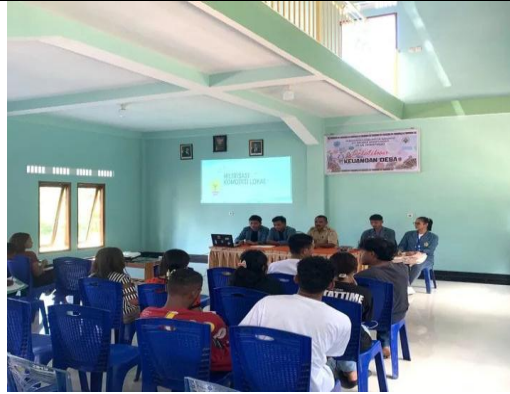
Gambar 2 : koordinasi dengan pihak desa dan pengurus karang taruna