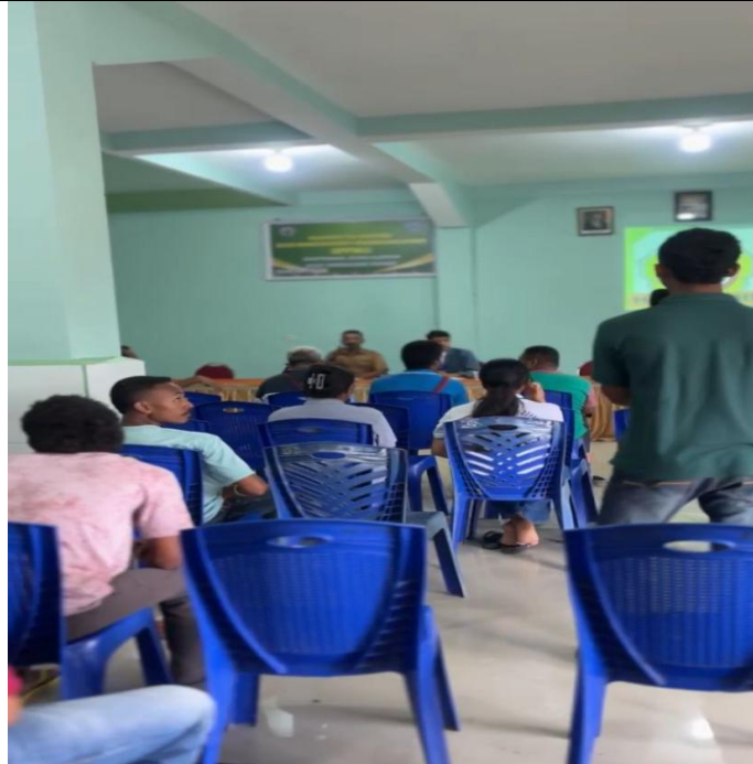
Gambar 6: Interaksi Peserta dalam Tanya Jawab

Setelah materi utama disampaikan, sesi dilanjutkan dengan tanya jawab yang menjadi wadah bagi peserta untuk menyampaikan pemikiran, kritik, serta aspirasi. Salah satu peserta berdiri dan menyampaikan pertanyaan secara langsung kepada narasumber, menunjukkan adanya rasa ingin tahu yang tinggi serta keterlibatan kritis dari peserta.