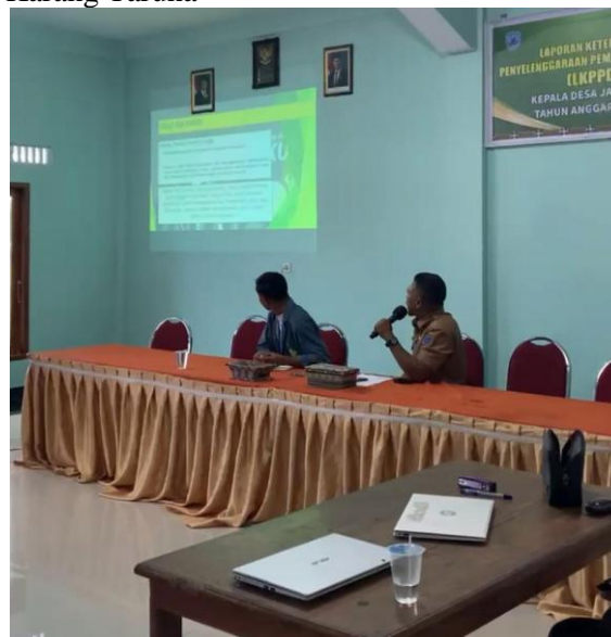
Gambar 5: Kegiatan Sosialisasi

Kegiatan dimulai dengan sesi sosialisasi yang mengusung tema “Peran Karang Taruna dalam Meningkatkan Kesejahteraan Masyarakat”. Sosialisasi ini menjadi langkah awal untuk membangun kesadaran kolektif mengenai potensi dan fungsi strategis Karang Taruna dalam pembangunan desa.