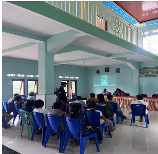
Gambar 8: Evaluasi Akhir Bersama Peserta

Tahapan akhir kegiatan adalah sesi evaluasi, yang bertujuan untuk menilai efektivitas pelaksanaan serta menangkap kesan dan saran dari peserta. Evaluasi dilakukan dalam format diskusi terbuka, di mana peserta menyampaikan tanggapan terhadap materi, metode penyampaian, dan relevansi kegiatan dengan kebutuhan desa.