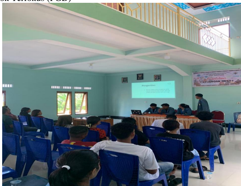
Gambar 7: FGD dengan Perwakilan Karang Taruna dan Masyarakat