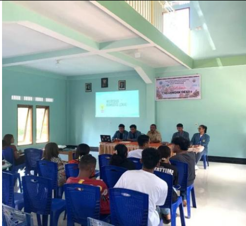
Gambar 3 : Tindak Lanjut