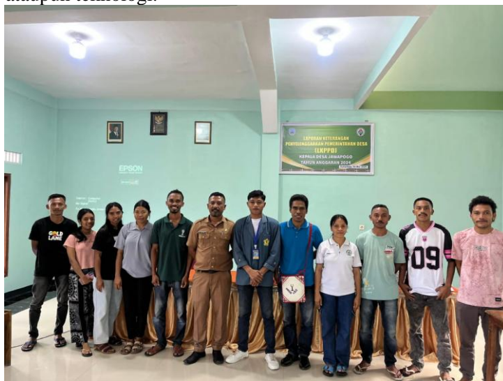
Gambar 1: Lokasi kegiatan

Kurangnya pelatihan dan pendampingan dari pihak eksternal seperti pemerintah atau Lembaga sosial juga membuat Karang Taruna kesulitan dalam mengembangkan inovasi program yang sesuai dengan kebutuhan masyarakat. Mereka belum memiliki akses yang cukup terhadap pelatihan kewirausahaan, pengelolaan organisasi, ataupun teknologi.