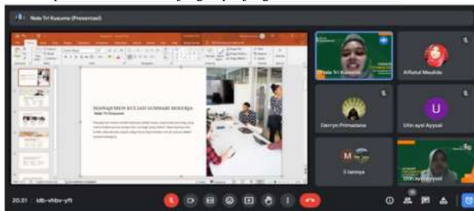
Gambar 3. Penyampaian dari Pemateri 2

Berdasarkan hasil diskusi dan survei pasca kegiatan, 80% peserta abdimas menyatakan mampu membuat rencana anggaran pribadi sederhana setelah mengikuti pelatihan. Peserta juga menilai materi ini membantu mereka memahami bagaimana financial planning dapat diterapkan untuk usaha kecil maupun keuangan pribadi. Temuan ini konsisten dengan hasil pengabdian oleh Irdawati et al., (2025) yang menemukan bahwa pelatihan manajemen keuangan berbasis literasi digital mampu meningkatkan perilaku keuangan rasional di kalangan pemuda pelaku UMKM. Selain itu, teori Lusardi & Mitchell, (2014) tentang financial literacy mendukung hasil ini, bahwa pemahaman perencanaan keuangan sejak usia muda memiliki korelasi positif terhadap stabilitas finansial jangka panjang.