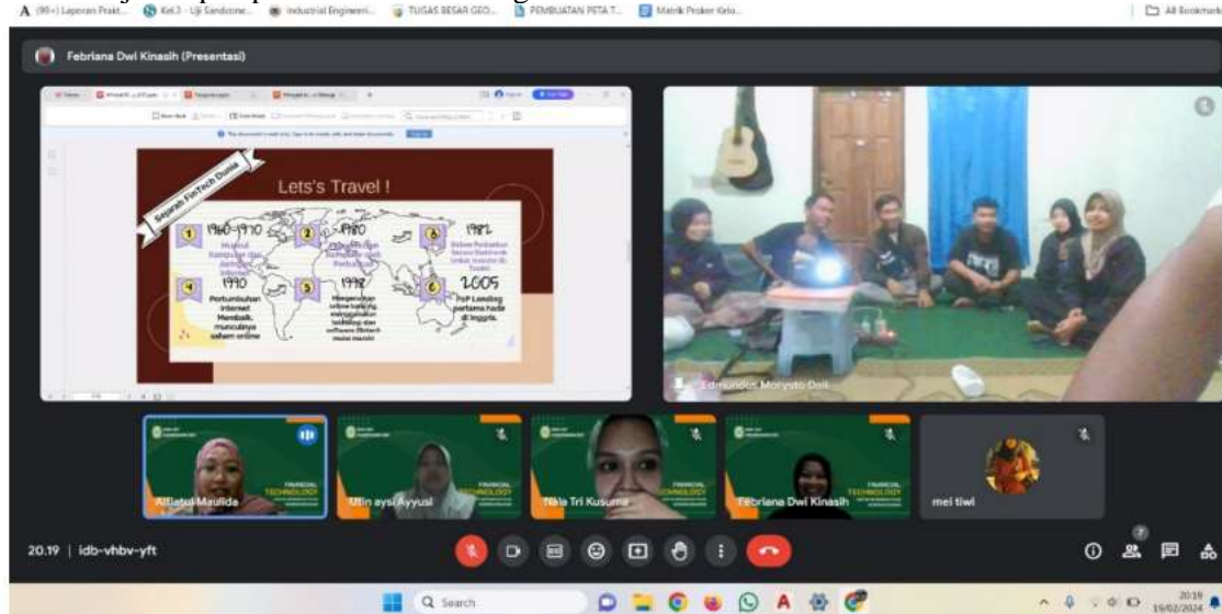
Gambar 2. Penyampaian dari Pemateri 1

relevan dengan kebutuhan usaha mikro. Kegiatan pengabdian ini menunjukkan adanya peningkatan literasi keuangan di kalangan peserta yang sesuai dengan hasil penelitian Irdawati et al., (2025) yang menyebutkan bahwa edukasi fintech berperan dalam meningkatkan adopsi teknologi pada UMKM. Selain itu, diskusi interaktif juga mengungkap bahwa sebagian peserta mulai mempertimbangkan integrasi sistem pembayaran digital dan pencatatan keuangan otomatis, sebagai bentuk adaptasi terhadap transformasi digital. Temuan ini mengonfirmasi teori Noe et al., (2020) mengenai pentingnya learning and development dalam membentuk perilaku kerja adaptif pada era ekonomi digital.