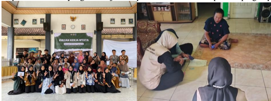
Gambar 2. Sosialisasi dan Pendampingan Pembuatan NIB

Peluang pengembangan ke depan meliputi penyediaan pelatihan lanjutan untuk administrasi daring dan pengelolaan izin usaha lainnya. Pemerintah desa dapat menindaklanjuti dengan membentuk tim layanan digitalisasi UMKM agar legalitas usaha menjadi bagian dari budaya bisnis masyarakat desa. Dokumentasi kegiatan disajikan pada Gambar 1 yang menunjukkan proses sosialisasi dan pendampingan pembuatan NIB.