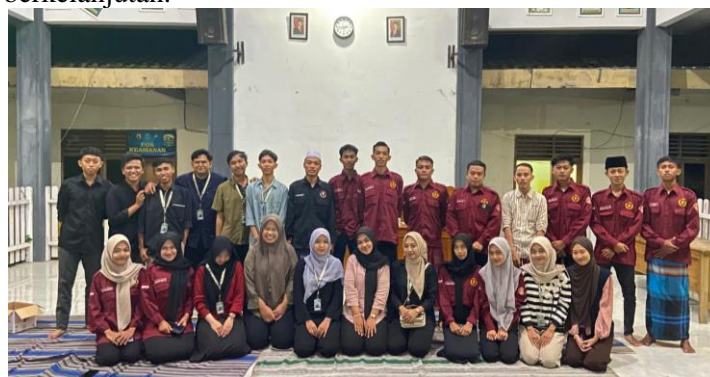
Gambar 3. Fokus Group Discussion Bersama Karang Taruna Desa Tlogoagung

Kerja sama antara mahasiswa Tim Pengabdian Masyarakat dan Karang Taruna desa menjadi kunci dalam mengoptimalkan kebijakan pendampingan Usaha Mikro, Kecil, dan Menengah (UMKM) di Desa Tlogoagung. Kolaborasi ini dimulai dari diskusi bersama dengan Karang Taruna terkait pemetaan kebutuhan pelaku UMKM, dilanjutkan dengan penyusunan program pendampingan yang mencakup legalitas usaha melalui pembuatan Nomor Induk Berusaha (NIB), yang menjadi dasar penting bagi pelaku usaha untuk mendapatkan akses permodalan dan pasar yang lebih luas. Di sisi lain, branding produk UMKM turut menjadi perhatian utama melalui pembuatan logo, desain kemasan, dan strategi promosi media sosial yang dirancang secara partisipatif. Pemetaan titik lokasi usaha UMKM melalui Google Maps menjadi langkah strategis berikutnya untuk meningkatkan visibilitas usaha secara daring. Melalui kerja sama ini, mahasiswa Tim Pengabdian Masyarakat dan Karang Taruna mampu menciptakan ekosistem pengembangan UMKM desa yang adaptif terhadap perkembangan teknologi dan kebutuhan pasar saat ini. Oleh karena itu keterlibatan Karang Taruna pada kolaborasi ini menjadi salah satu faktor pendukung keberhasilan dalam menjangkau pemuda desa sebagai agen perubahan. Sinergi mahasiswa Tim Pengabdian Masyarakat, Karang Taruna, dan Pelaku UMKM dapat meningkatkan kapasitas usaha secara teknis, legal, adaptif terhadap teknologi, dan berorientasi pada pembangunan ekonomi berkelanjutan.