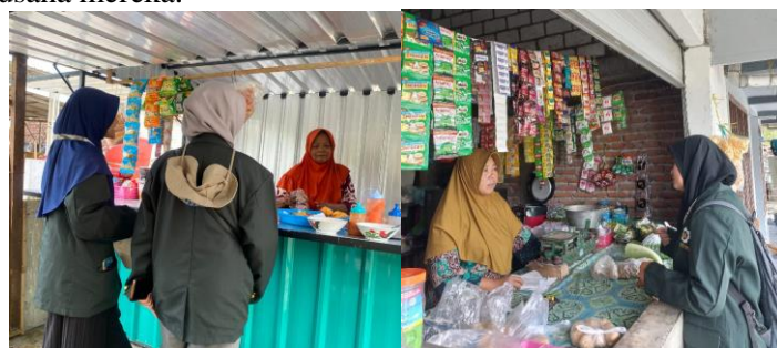
Gambar 1. Survey UMKM di Desa Tlogoagung

Permasalahan pada kegiatan pengabdian yang dilakukan oleh mahasiswa Tim Pengabdian Masyarakat Kelompok 108 yang berlokasi di Desa Tlogoagung, Kecamatan Kembangbahu, Kota Lamongan adalah kurangnya pemahaman serta masyarakat tentang pentingnya Nomor Induk Berusaha masih banyak diantara para UMKM belum memiliki Nomor Induk Berusaha (NIB) sebagai bentuk legalitas berdirinya usaha, bahkan tidak sedikit dari pelaku UMKM sendiri yang memang tidak tau dan tidak paham apa itu NIB. Sekitar 80 UMKM di Desa Tlogoagung belum memiliki NIB sebagai bentuk legalitas usaha mereka, hanya 2 sampai 3 UMKM saja yang memiliki NIB. Tidak hanya itu permasalahan yang ditemui pada UMKM di Desa Tlogoagung yakni kurangnya minat dan daya beli masyarakat terhadap UMKM yang ada di Desa mereka, salah satu faktornya yakni kurang menariknya produk yang dijual dari segi kemasan rasa atau bahkan rupa, kebersihan dan penataan serta pelayanan yang kurang baik. Maka dari itu perlu adanya inovasi pada UMKM yang ada di Desa Tlogoagung dalam pengelolaan usaha, di mana banyak pelaku usaha yang terbatas pada pasar lokal dan kesulitan dalam mengembangkan produk baru atau meningkatkan kualitas produk. Oleh karena itu kelompok Tim Pengabdian Masyarakat 108 hadir membantu para pelaku UMKM untuk meningkatkan daya saing dan produktivitas usaha mereka.