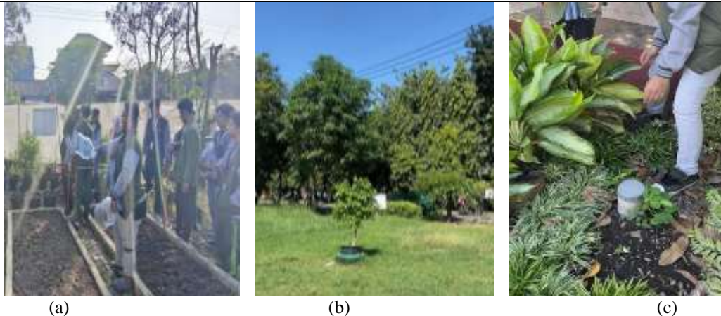
Gambar 3 Lokasi survei di tiga lokasi tujuan (a) Green Hose (b) Area belakang Sentra Wisata Kuliner (c) Bantran Sungai RT 09

Kegiatan pembuatan biopori dilaksanakan di kantor kelurahan Balas Klumpruk mengikuti arahan kepala kelurahan. Secara teknis, proses pembuatan dimulai dengan menyiapkan komponen utama yakni galon plastik dan pipa PVC. Galon dipotong dan dilubangi menggunakan solder, sedangkan pipa dipotong sesuai ukuran yang dibutuhkan untuk menjadi saluran pemasukan sampah organik. Selanjutnya, seluruh komponen dirangkai menjadi satu kesatuan sesuai desain biopori yang telah dirancang sebelumnya. Penyesuaian ukuran dan desain didasarkan hasil pengkajian dan pengembangan dari penelitian sebelumnya, guna meningkatkan efektivitas daya serap dan efisiensi penggunaan bahan daur ulang sehingga sesuai Peraturan Menteri Negara Lingkungan Hidup NO 12 Tahun 2009 bahwa lubang resapan biopori dipasang tegak lurus ke dalam tanah dengan diameter 10-25 cm. Semakin banyak jumlah lubang ventilasi dan semakin besar diameter biopori maka semakin tinggi pula daya serap dan kapasitas infiltrasi yang dihasilkan.