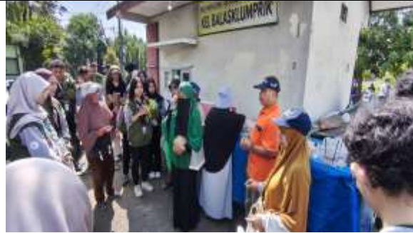
Gambar 7 Evaluasi