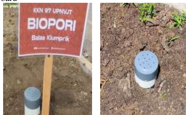
Gambar 6. Lubang resapan biopori (LRB)

Berdasarkan aspek efektivitas, hasil pengamatan menunjukkan bahwa lubang biopori mampu mempercepat infiltrasi air hujan ke dalam tanah sesuai dengan penelitian Pandeiro & Thomas (2019) menyatakan bahwa tanah berpori terbuka dapat meningkatkan laju resapan air. Selain itu, kedalaman lubang biopori dilokasi kegiatan ini rata-rata hanya mencapai 65 cm, sedikit lebih dangkal dibandingkan rekomendasi penelitian Sine & Kolo (2021) yang menyarankan kedalaman hingga 100 cm untuk hasil optimal karena tersedia oksigen bagi cacing dan mikroorganisme pengurai lainnya untuk mendukung proses dekomposisi organik secara optimal. Meskipun begitu, kegiatan berjalan lancar dan masih diperlukan penyesuaian dan evaluasi lanjutan terhadap fungsi lubang resapan biopori (KRB) agar efisiensinya semakin optimal. Beberapa Tindakan yang perlu dilakukan antara lain membersihkan rumput liat di sekitar lubang yang dapat menghalangi masuknya air serta melakukan pengecekan kondisi sampah di dalam lubang resapan biopori (LRB) secara berkala. Pengecekan ini mencakup pengambilan kompos yang terbentuk dan pengisian ulang dengan sampah organik baru