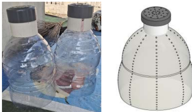
Gambar 2 Desain lubang resapan biopori (LRB)

Hasil perencanaan yang diperoleh dari tahap sebelumnya adalah pembuatan biopori sederhana dengan memanfaatkan galon plastik karena memiliki diameter yang cukup besar dibandingkan pipa PVC, sehingga lebih efektif.