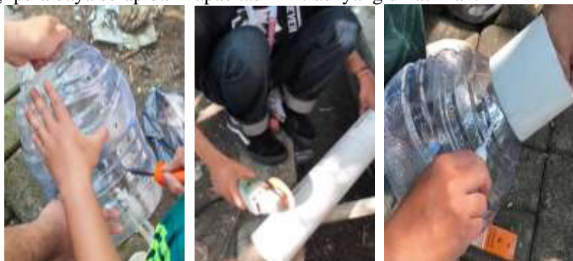
Gambar 4. Proses pembuatan biopori

Kegiatan pembuatan biopori dilaksanakan di kantor kelurahan Balas Klumpruk mengikuti arahan kepala kelurahan. Secara teknis, proses pembuatan dimulai dengan menyiapkan komponen utama yakni galon plastik dan pipa PVC. Galon dipotong dan dilubangi menggunakan solder, sedangkan pipa dipotong sesuai ukuran yang dibutuhkan untuk menjadi saluran pemasukan sampah organik. Selanjutnya, seluruh komponen dirangkai menjadi satu kesatuan sesuai desain biopori yang telah dirancang sebelumnya. Penyesuaian ukuran dan desain didasarkan hasil pengkajian dan pengembangan dari penelitian sebelumnya, guna meningkatkan efektivitas daya serap dan efisiensi penggunaan bahan daur ulang sehingga sesuai Peraturan Menteri Negara Lingkungan Hidup NO 12 Tahun 2009 bahwa lubang resapan biopori dipasang tegak lurus ke dalam tanah dengan diameter 10-25 cm. Semakin banyak jumlah lubang ventilasi dan semakin besar diameter biopori maka semakin tinggi pula daya serap dan kapasitas infiltrasi yang dihasilkan.