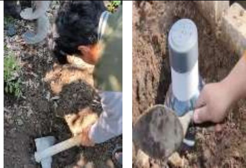
Gambar 5. Proses pembuatan lubang dan penanaman biopori

Hasil kegiatan antara warga yakni POKTAN dan mahasiswa KKN menunjukkan adanya peningkatan kesadaran masyarakat dalam mengelola sampah organik menjadi kompos sederhana. Seluruh pihak yang terlibat menunjukkan partisipasi aktif serta kerja sama yang kooperatif. Hal ini terlihat dari antusiasme para peserta, khususnya para pengurus kelompok tani (POKTAN) yang hadir dan memberikan dukungan secara langsung, termasuk dalam penyediaan alat-alat yang dibutuhkan pembuatan lubang seperti cangkul dan bor tanah. Hasil tersebut sejalan dengan penelitian Siswadi & Syaifuddin (2024) yang menunjukkan bahwa tingkat partisipasi masyarakat dalam kegiatan ini relatif lebih tinggi, karena adanya pendekatan Participatory Action Research (PAR) yang melibatkan masyarakat sejak tahap perencanaan.